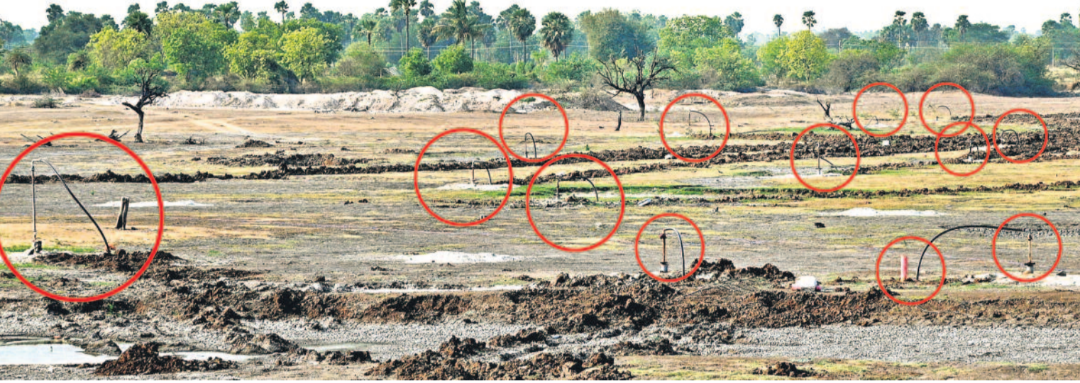
కరువుతో చెరువు ఎండిపోయినా.. పంటలను కాపాడేందుకు తండ్రిగారు నల్లగొండ జిల్లా ముప్పవల్లి రైతులు. బొక్కనల్లెనల్ల బోర్డు వేసి నీళ్లు తోడుకునేందుకు ప్రయత్నిస్తున్నారు. నిరుదీ పరకు నీళ్లతో కళకళలాడిన ఊరి చెరువు ప్రస్తుతం అడుగుంటింది. దాని పరిధిలోని 150 ఎకరాల్లో పంటలు ఎందుముఖం వట్టాయి. భూగర్భ జలాల్లోకి బోర్లు వట్టిపోయినాయి. దీంతో చెరువు గర్భంలోనే 50 వరకు బోర్లను మైపుల ద్వారా పాలాలకు నీళ్లును తరలిస్తున్నారు.