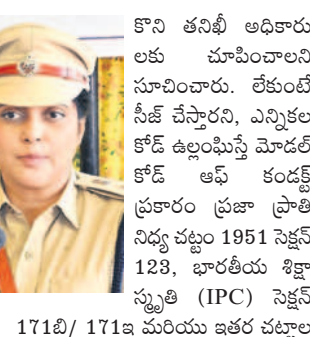
171బి/171ఐ మరియు ఇతర చట్టాల ప్రకారం కేసులు నమోదు చేస్తామని హెచ్చరించారు.

• నల్లగొండ ఎస్పీ చందనా దీప్తి నీలగిరి, ఏప్రిల్ 8 : పార్లమెంట్ ఎన్నికల నేపథ్యంలో రూ.50వేలకు పైబడిన సామగ్రి కొనుగోళ్లు చేసే తీసుకొల్పాల్సి వస్తే సరైన ఆధారాలు తమ వెంట ఉంచుకోవాలని జిల్లా ఎస్పీ చందనా దీప్తి సోమవారం ఒక ప్రకటనలో సూచించారు. ఎన్నికల ప్రవర్తన నియమావళి అమలులో భాగంగా ఓటర్లను ప్రభావితం చేసే నగదు, వడ్డీ, బంగారం, ఇతర వస్తువులు సరఫరా కాకుండా నిరంతరం నిషేధించుతూ తనిఖీలు నిర్వహిస్తున్నట్లు తెలిపారు. జిల్లా ప్రజలు శుభకార్యాలకు బంగారం, రూ.50 వేలకు మించి ఉన్న సామగ్రిని తీసుకొట్టబప్పుడు సరైన ఆధారాలు, సంబంధిత పత్రాలు వెంట ఉంచు