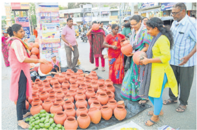
నల్లగొండలో ఉగాది పచ్చడి కోసం కుండలు కొనుగోళ్లు చేస్తున్న మహిళలు