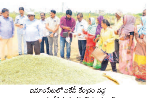
ఇమాంపేటలో బజ్జీ కేంద్రం వద్ద ధాన్యాన్ని పరిశీలిస్తున్న కలెక్టర్ వెంకట్రామ్

సూర్యాపేట రూరల్, ఏప్రిల్ 8 : ధాన్యం కొనుగోళ్లు వేగవంతం చేయాలని, వెంటవెంటనే ధాన్యాన్ని మిల్లులకు తరలించాలని సూర్యాపేట కలెక్టర్ ఎస్.వెంకట్రామ్ అధికారులకు సూచించారు. సూర్యాపేట మండల పరిధిలోని ఇమాంపేటలో సోమవారం బజ్జీ కేంద్రంలో ఏర్పాటు చేసిన ధాన్యం కొనుగోళ్లు కేంద్రాన్ని పరిశీలింపి మాట్లాడారు. ధాన్యం కొనుగోళ్లు కేంద్రాలకు 354.896 మెట్రిక్ టన్నుల ధాన్యం అంచనా ఉందని, ఇప్పటి వరకు 241.0 మెట్రిక్ టన్నుల ధాన్యం వచ్చిందని తెలిపారు. రైతులు తాలు లేకుండా, ధాన్యం తేమే శాతం 17 మించకుండా నాణ్యమైన ధాన్యాన్ని కొనుగోళ్లు కేంద్రాలకు తీసుకొచ్చి మద్దతు ధర పొందాలన్నారు.