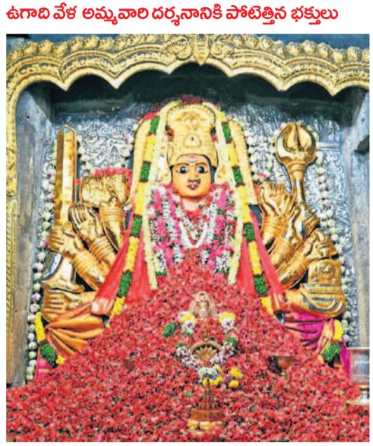
వరంగల్: లక్ష గులాబీలతో భద్రకాళి అమ్మవారికి పుష్పార్చన