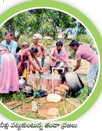
నీళ్ళ పట్టుకుంటున్న తండా ప్రజలు