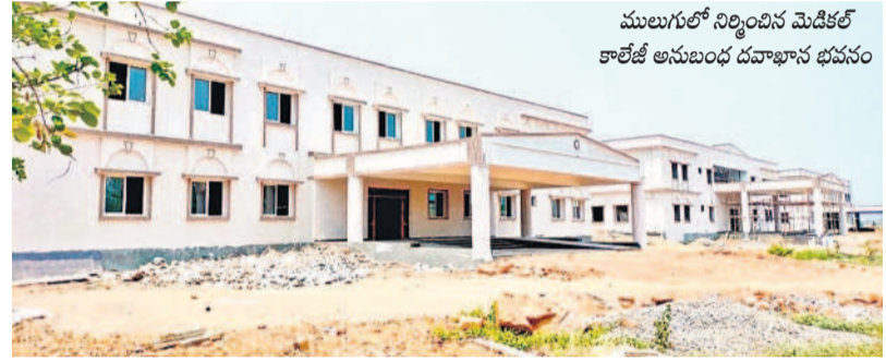
ములుగులో నిర్మించిన మెడికల్ కాలేజీ అనుబంధ దవాఖాన భవనం