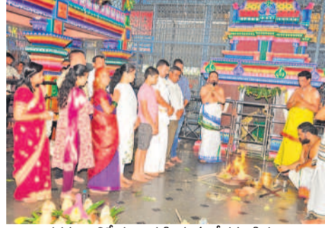
శతమటాటిషిక నిర్వహిస్తున్న వేదపండితులు

టాటిషికతో ముగిశాయి. ఆలయ ప్రధానాచార్యులు శ్రీకృష్ణాచార్యులు ఆధ్వర్యంలో వేదపండితులు 108 కలశములతో