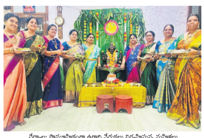
చేర్యాల: సామాజికంగా ఉధిరి వేడుకలు నిర్వహిస్తున్న మహిళలు