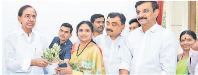
బీఆర్ఎస్ అధినేత కేసీఆర్ కు ఉగాది శుభాకాంక్షలు తెలుపుతున్న దుబ్బాక ఎంపీపీ కొత్త పుష్పలతాకిషన్ రెడ్డి దంపతులు