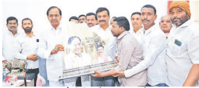
దుబ్బాక: బీఆర్ఎస్ అధినేతకు జ్ఞాపిక అందజేస్తున్న దుబ్బాక నియోజకవర్గ బీఆర్ఎస్ నాయకులు