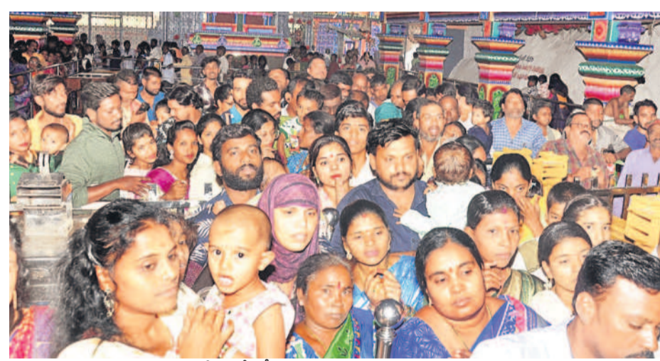
నాచగిరికేంద్రంలో లక్ష్మీనరసింహస్వామిని దర్శించుకుంటున్న భక్తులు

వర్గల్, ఏప్రిల్ 9: నాచగిరికేంద్రంలో కొలువైన లక్ష్మీనరసింహస్వామి బ్రహ్మోత్సవాలు మంగళవారం ఉడయం శతమ