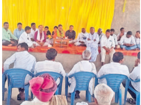
దుబ్బాక: దుబ్బాక వైశ్యవర్గంలో పంచాంగ శ్రావణం