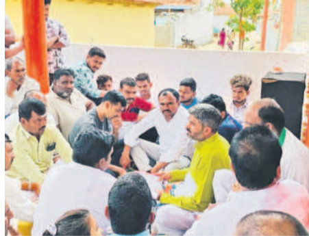
బెజ్జంకి: బెజ్జంకిలో పంచాంగం చెప్పుతున్న పురోహితుడు