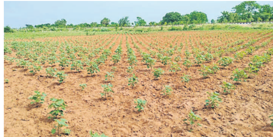
గజ్వేల్ నియోజకవర్గంలో సాగుచేసిన పత్తి (ఫైల్)

గజ్వేల్, ఏప్రిల్ 9: కేంద్ర ప్రభుత్వం పత్తి రైతులపై భారం మోపింది. గజ్వేల్ ఉన్న పత్తి విత్తనాల ప్యాకెట్ ధరను ఈ ఏటా రూ.11 పెంచింది. దీంతో జిల్లా వ్యాప్తంగా రైతులపై మరింత భారం పడుతున్నది. కేంద్ర ప్రభుత్వం బీటీ-2 విత్తన ప్యాకెట్ ధరను పెంచుతూ ఇటీవల తీసుకున్న నిర్ణయంతో రైతులపై అదనపు భారాన్ని మోపింది. జిల్లా వ్యాప్తంగా ఏటా రైతులు 1.50 లక్షల ఎకరాల్లో పత్తి సాగు చేస్తారు. ప్రతి యేడు సాగు ఖర్చులు పెరుగుతున్నా రైతులు మాత్రం పత్తి పంటను సాగు చేయడంలో వెనుకంజే చేయ