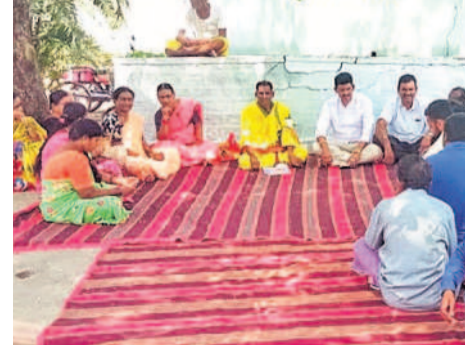
సిద్దిపేట టౌన్: వేంకటేశ్వరస్వామి ఆలయంలో పంచాంగ పఠనం వినిపిస్తున్న వేద పండితుడు