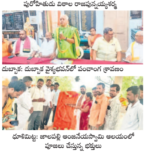
ధూళిమిట్ట: జాలపల్లి అంజనేయస్వామి ఆలయంలో పూజలు చేస్తున్న భక్తులు