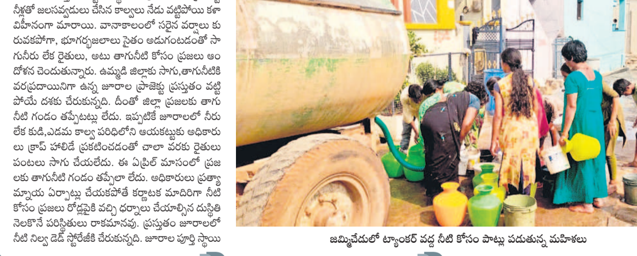
జమ్మిచేరులో ట్యాంకర్ వద్ద నీటి కోసం పొద్దు పడుతున్న మహిళలు

నీటి మట్టం 9.657 టీఎంసీలు కాగా, 3.546 టీఎంసీలు డెడ్ స్టోరేజీలో ఉంది. మిగతా నీటిని మాత్రమే గ్రామీణి ద్వారా విడుదల చేసుకోవడానికి అవకాశం ఉంటుంది. ప్రస్తుతం ప్రాజెక్టులో 3.546 టీఎంసీల నీరు మాత్రమే నిల్వ ఉన్నది. దీంతో ప్రజలు తాగు నీటి కష్టాలు ఎదుర్కొనే పరిస్థితి నెలకొన్నది. వడపోత కిందటి కరువు పునరావృతం.. ఎగువన వర్షాలు సరిగా కురువని కారణంగా ప్రస్తుతం జూరాల ప్రాజెక్టులో నీటి నిల్వలు పూర్తిగా తగ్గిపోయాయి. 2016లో జూరాల ప్రాజెక్టు డెడ్ స్టోరేజీకి చేరుకోగా, జోగుళాంబ గద్దాల, వనపర్తి, నాగర్ కర్నూల్, నారాయణపేట, అచ్యుతపేట పట్టణాలకు తీవ్ర నీటి ఇబ్బంది ఏర్పడింది. దీంతో ప్రత్యేకంగా మోటార్లు ఏర్పాటు చేసి డెడ్ స్టోరేజీలో ఉన్న నీటిని తాగునీటి అవసరాల కోసం తరలించారు. ప్రస్తుతం అదే పరిస్థితి నెలకొన్నది. ఉమ్మడి జిల్లాలో తాగు నీటి అవసరాలకు ఏడాదికి ఎండ తీవ్రత అవిరి రూపంలో వెళ్లి నీటిని కలుపుకొని 1.50 టీఎంసీలు అవసరం. ప్రతి రోజూ 74 ఎంఎల్ డీలు అవసరమున్నట్లు మిషన్ భగీరథ అధికారులు చెబుతున్నారు. ప్రస్తుతం జూరాల జలాశయం పూర్తిగా అడుగుంటిపోగా డెడ్ స్టోరేజీలో కలిపి 3.546 టీఎంసీల నీరు మాత్రమే అందుబాటులో ఉన్నది. ప్రస్తుతమున్న నీరు ఏప్రిల్ 15వ తేదీ తాగునీటికి సరిపోయే