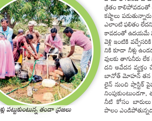
నీళ్ళ పట్టుకుంటున్న తండా ప్రజలు

నర్సింహాలపేట, ఏప్రిల్ 9 : తాగునీటి కోసం తండాలు తండ్లాడుతున్నాయి. గుక్కెడు నీటికోసం బోధ, వ్యవసాయ బావుల వద్దకు పరుగులు పెడుతున్నాయి. రోజురోజుకూ ఎండలు ముదరడం, తాగునీటి ఎద్దడి నివారణకు ప్రభుత్వం ముందస్తు చర్యలు తీసుకోకపోవడంతో ప్రజలు అల్లాడుతున్నారు. కేసీఆర్ ప్రభుత్వం మిషన్ భగీరథ ద్వారా వల్లెపట్టం అనే తండా లోతుండా ఇంటింటికీ శుద్ధి చేసిన జలాలను అందించింది. గత పదేళ్లలో ఎక్కడా తాగు, సాగునీటికి జలం ఇబ్బందులు పడిన దాఖలాలు లేవు. కానీ, ప్రస్తుతం కాంగ్రెస్ ప్రభుత్వం వచ్చిన అతి కొద్ది రోజుల్లోనే పద్దెళ్ళ కిందటి రోజులు పునరావృతమవుతున్నాయి. ఇప్పటికే మహబూబాబాద్ జిల్లాలో చాలాచోట్ల నీటి కష్టాలు మొదలవగా ఇప్పుడు బాసుతండా దావాసులకు గడ్డ పరిస్థితి దాపులందింది. కాంగ్రెస్ వచ్చింది.. కరువు తెచ్చిందంటూ వారు ఆవేదన వ్యక్తం చేస్తున్నారు.