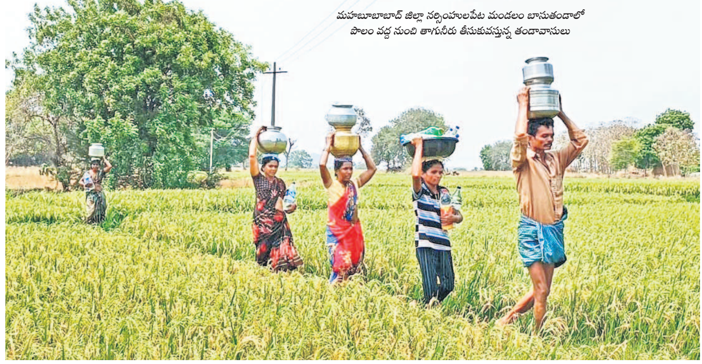
మహబూబాబాద్ జిల్లా నర్సింహాలపేట మండలం బాసుతండాలో పొలం వద్ద నుంచి తాగునీరు తీసుకువస్తున్న తండావాసులు

ను ప్రారంభించనున్నది. ఇప్పటికే ఉమ్మడి వరంగల్ జిల్లాలో వరంగల్, జనగామ, మహబూబాబాద్, భూపాలవల్లిలో ప్రభుత్వ మెడికల్ కాలేజీలు కొనసాగుతున్నాయి. ఈ తరుణంలో ఉగాది పండుగ సందర్భంగా నర్సంపేట, ములుగు మెడికల్ కాలేజీలకు అనుమతులు లభించడం శుభవరణం. కేసీఆర్ ప్రభుత్వం గతేడాది నర్సంపేట, ములుగు కాలేజీల ఏర్పాటుకు ప్రతిపాదనలు పంపగా తాజాగా ఎన్ఎంసీ అనుమతులు దశాయి. దీంతో సుమారు 50 నుంచి 100 ఎంబీబీఎస్ సీట్లతో ప్రవేశాలు ప్రారంభం కానున్నాయి. ఇందుకోసం ఎన్ఎంసీ బృందం సభ్యులు త్వరలో ములుగు కళాశాలను సందర్శించి పోలిక పనులకు పరిశీలించి ఈ విధానం సంతకం చేస్తారు. రాష్ట్ర ప్రభుత్వం ఎన్ఎంసీ నిబంధనల మేరకు ఎన్ని ఏర్పాట్లను పూర్తి చేయాల్సి ఉంటుంది.