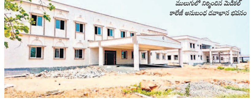
ములుగులో నిర్మించిన మెడికల్ కాలేజీ అనుబంధ దవాఖాన భవనం