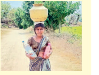
ఇంటి ముందు చల్లదానికి నీళ్ళ లేవు

గుక్కెడు నీటి కోసం కిలోమీటర్ల దూరం నడిచి వెళ్ళా గుక్కెడు నీటి కోసం బోధ, వ్యవసాయ బావుల వద్దకు పరుగులు పెడుతున్నాయి. రోజురోజుకూ ఎండలు ముదరడం, తాగునీటి ఎద్దడి నివారణకు ప్రభుత్వం ముందస్తు చర్యలు తీసుకోకపోవడంతో ప్రజలు అల్లాడుతున్నారు. కేసీఆర్ ప్రభుత్వం మిషన్ భగీరథ ద్వారా వల్లెపట్టం అనే తండా లోతుండా ఇంటింటికీ శుద్ధి చేసిన జలాలను అందించింది. గత పదేళ్లలో ఎక్కడా తాగు, సాగునీటికి జలం ఇబ్బందులు పడిన దాఖలాలు లేవు. కానీ, ప్రస్తుతం కాంగ్రెస్ ప్రభుత్వం వచ్చిన అతి కొద్ది రోజుల్లోనే పద్దెళ్ళ కిందటి రోజులు పునరావృతమవుతున్నాయి. ఇప్పటికే మహబూబాబాద్ జిల్లాలో చాలాచోట్ల నీటి కష్టాలు మొదలవగా ఇప్పుడు బాసుతండా దావాసులకు గడ్డ పరిస్థితి దాపులందింది. కాంగ్రెస్ వచ్చింది.. కరువు తెచ్చిందంటూ వారు ఆవేదన వ్యక్తం చేస్తున్నారు.