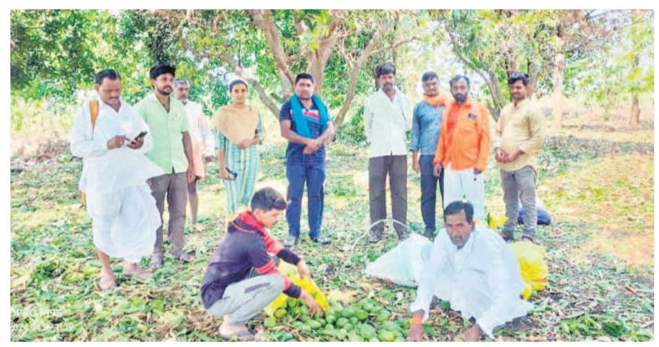
మందర్న శివారులో రాలిపోయిన మామిడికాయలను పరిశీలిస్తున్న వ్యవసాయాధికారులు, రైతులు

ఆరుగాలం కట్టించి సాగు చేసిన పంట కండ్ల ముందే కడగండ్లు మిగిల్చింది. మాయదారి రాళ్లవాన రైతుల పుట్టిమొందింది. ఆకాల వర్షం దెబ్బకు చేతికొచ్చిన వరి పంట నేలరాల్చింది. నిజామాబాద్ జిల్లాలోని ఏడు మండలాలలో సోమవారం రాత్రి కురిసిన పడగండ్ల వాన రైతులకు దుఃఖంలో ముంచింది. సుమారు వెయ్యికి పైగా ఎకరాల్లో వరి పంట దెబ్బతిన్నది. కోతకడలో ఉన్న పంట వర్ష భీభత్సంతో పండుగ రోజే దెబ్బతిన్నదంతో రైతులు ఆవేదన వ్యక్తం చేస్తున్నారు.