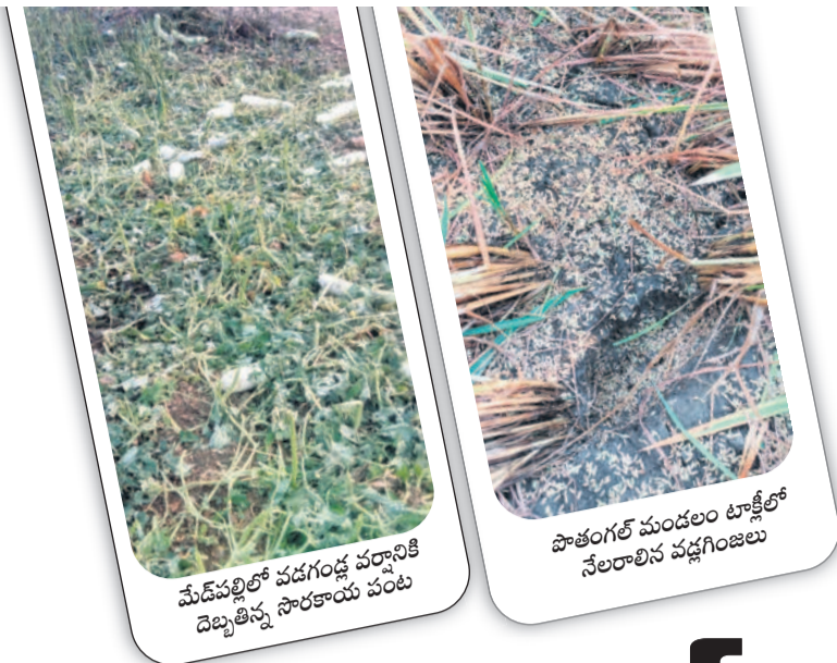
మేడ్పల్లిలో పడగండ్ల వర్షానికి దెబ్బతిన్న సారకాయ పంట