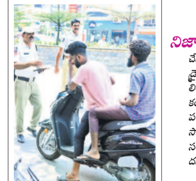
-వినాయకనగర్, ఏప్రిల్ 9

నిజామాబాద్ నగరంలో పోలీసులు విస్తృత తనిఖీలు చేపట్టారు. మంగళవారం పలుచోట్ల వాహనదారులను అపి డ్రైవింగ్ లైసెన్స్, వాహనానికి సంబంధించిన పత్రాలను పరిశీలింపారు. నిబంధనలు పాటించని వారికి జరిమానా విధించారు. కంఠేశ్వర్, ఎల్లమ్మగుట్ట మధ్య రెండు చోట్లా తనిఖీలు చేపట్టడంతో పండుగ వేళ వాహనదారుల నమయం వృథా అయ్యింది. పూజ సామగ్రి కొనుగోలు చేసేందుకు మార్కెట్కు వెళ్లే వాహనాధిపతుల సంబంధిత పత్రాలు వెంట తెచ్చుకోలేదని చెప్పినా బినిమిమకోల్ దని కొందరు ఆవేదన వ్యక్తం చేశారు.