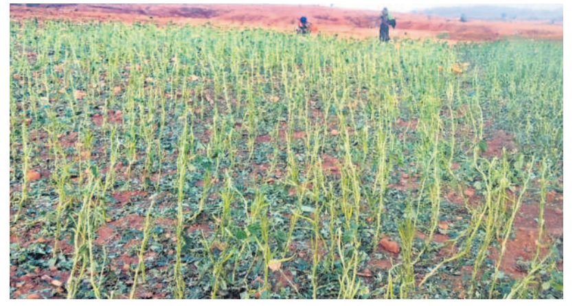
మేడ్పల్లిలో పడగండ్ల వానకు దెబ్బతిన్న గోరుబిళ్ళకు పంట

5 నిజామాబాద్, బుధవారం 10 ఏప్రిల్ 2024 NIZAMABAD