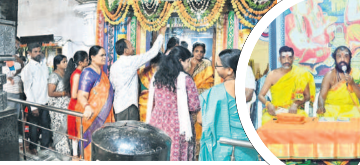
నీలకంఠేశ్వరాలయంలో పూజలు చేస్తున్న భక్తులు, వందేతుల పంచాంగ శ్రవణం