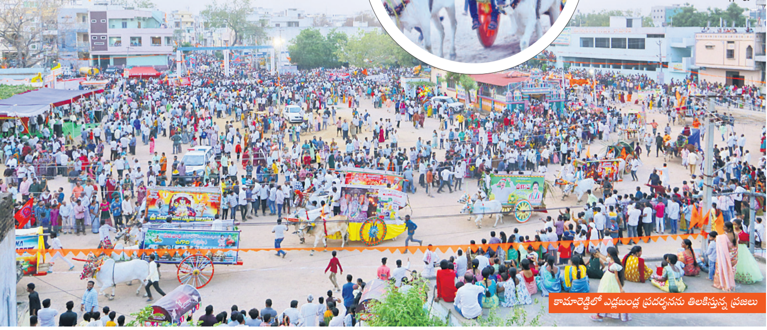
కామారెడ్డిలో విష్ణుబండ్ల ప్రదర్శనను తిలకిస్తున్న ప్రజలు