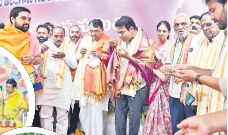
కామారెడ్డిలో వేదపండితుల పంచాంగ శ్రవణం