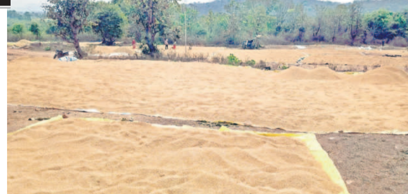
పెగడపల్లిలో రైతులు ఆరబోసిన ధాన్యం