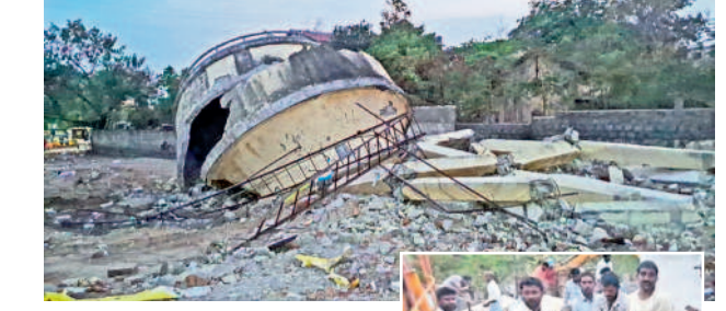
వరంగల్ బస్ స్టేషన్ ఆవరణలో కుప్పకూలిన వాటర్ ట్యాంక్ (ఇన్ సెల్) వాటర్ ట్యాంక్ శిథిలాల నుంచి బయటకు తీసుకువస్తున్న కార్మికులు

గొడ్డుకు నీళ్ళ లేక తిప్పలేం.. ఎండలు దంపికొడుతున్నాయి. నీళ్ళ లేక తిప్పలేం. ఎవరికి చెప్పినా పట్టించుకోవడం లేదు. పద్దేళ్లుగా నీళ్ళ కోసం తిప్పలు లేవు. పొద్దున్నే ఉపాది పనికి వెళ్ళి ఇంటికి వచ్చినందుకు నీళ్ళ కోసం పొలం పారడం లేదని వారు నీళ్ళ పట్టుకోవడం ఉన్నారు. ముమ్మలం అయితే ఎక్కడో అక్కడ తాగుతారు. గొడ్డు ఎక్కడా బతుకుతారు. ఇప్పుడు ఇక్కడ ఉంటే రేపు ఎక్కడ ఉంటుందో మా బతుకులు. ఇప్పటికైనా అధికారులు తాగునీటి గోసను తీర్చాలి.