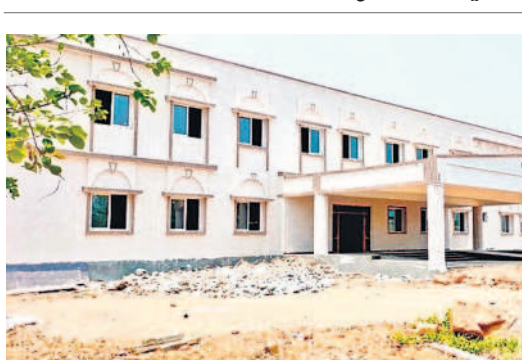
ములుగులో నిర్మించిన మెడికల్ కాలేజీ అనుబంధ దవాఖాన భవనం