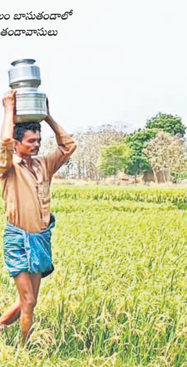
మహబూబాబాద్ జిల్లా నర్సింహలపేట మండలం బాసుతం దాలో పొలం వద్ద నుంచి తాగునీరు తీసుకువస్తున్న తండావాసులు

తాగునీటి కోసం తండాలు తండ్రాడుతున్నాయి. గుక్కెడు నీటి కోసం కిలోమీటర్ల దూరం నడిచి వెళ్ళా గుక్కెడు నీటి కోసం బోధ, వ్యవసాయ బావుల వద్దకు పరుగులు పెడుతున్నాయి. రోజురోజుకూ ఎండలు ముదరడం, తాగునీటి ఎద్దడి నివారణకు ప్రభుత్వం ముందస్తు చర్యలు తీసుకోకపోవడంతో ప్రజలు అల్లాడుతున్నారు. కేసీఆర్ ప్రభుత్వం ముప్పే భగీరథ ద్వారా వల్లెపట్టం అనే తండా లేకుండా ఇంటింటికీ శుద్ధి చేసిన జలాలను అందించింది. గత పదేళ్లలో ఎక్కడా తాగు, సాగునీటికి జనం ఇబ్బందులు పడిన దాఖలాలు లేవు. కానీ, ప్రస్తుతం కాంగ్రెస్ ప్రభుత్వం వచ్చిన అతి కొద్ది రోజుల్లోనే పద్దేళ్ల కిందటి రోజులు పునరావృతమవుతున్నాయి. ఇప్పటికే మహబూబాబాద్ జిల్లాలో చాలాచోట్ల నీటి కష్టాలు మొదలయ్యాయి. ఇప్పుడు బాసుతం దావాసులకు గడ్డ పరిస్థితి దాపులందింది. కాంగ్రెస్ వచ్చింది.. కరువు తెచ్చిందంటూ వారు ఆవేదన వ్యక్తం చేస్తున్నారు.