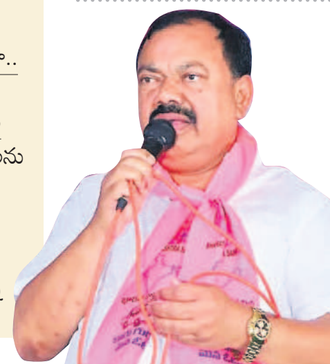
జోరుగా సన్నాహక సమావేశాలు