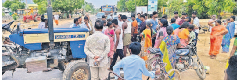
తిమ్మాపురంలో జనగాం - సూర్యాపేట జాతీయ రహదారిపై ధర్మా చేస్తున్న ప్రజలు

ఆర్ధసత్తి, ఏప్రిల్ 9 : 10 రోజులుగా మంచి నీళ్లు రావడం లేదని ప్రజలు మండలంలోని తిమ్మాపురం ఎక్స్ ప్రెస్ వద్ద పండుగ పూట మంగళవారం సూర్యాపేట - జనగాం జాతీయ రహదారిపై ధర్మా చేశారు. అధికారులు వెంటనే స్పందించి ట్యాంకర్ల ద్వారా నీటిని సరఫరా చేశారు.