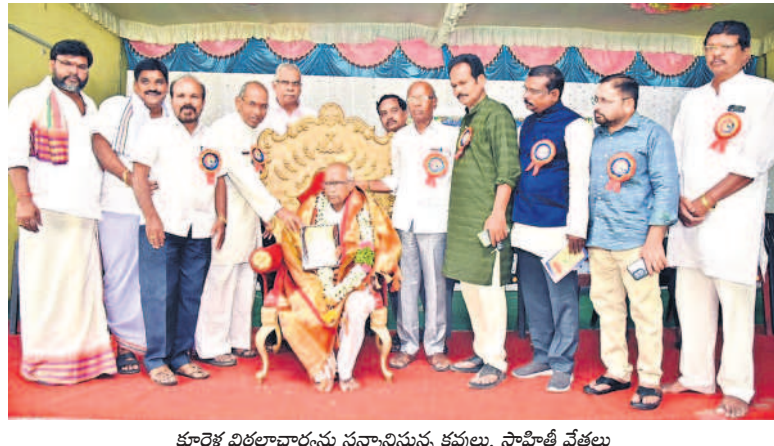
కూరకల్ విరలాచార్యులు సన్నాహక కవులు, సాహితీ వేత్తలు