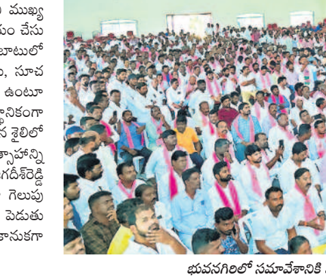
భువనగిరిలో సమావేశానికి హాజరైన బీఆర్ఎస్ శ్రేణులు (ఫైల్)

ఎన్నికల కోసం సన్నాహక సమావేశాల్లో కేడర్లను