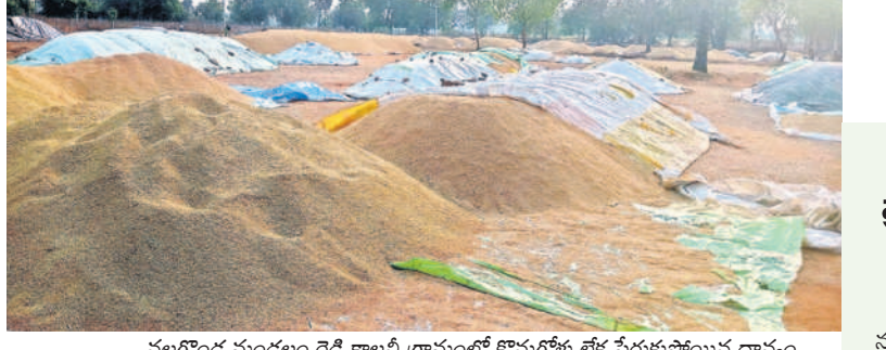
నల్లగొండ మండలం రెడ్డి కాలనీ గ్రామంలో కొనుగోళ్లు లేక పేరుకుపోయిన ధాన్యం