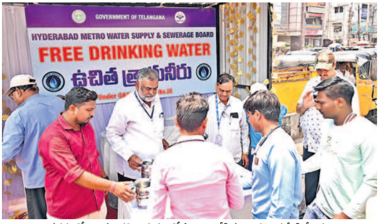
నగరంలో జలమందలి అభ్యర్థులలో ఏర్పాటు చేసిన ఉచిత తాగునీటి కేంద్రం