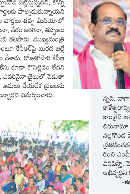
సమైక్య రాష్ట్రంలో వెనుకబాటుకు గురైన ఉమ్మడి నల్లగొండ జిల్లా బీఆర్ఎస్ హయాంలో అభివృద్ధి పథంలోకి వచ్చింది. కాంగ్రెస్ ప్రభుత్వం నిర్లక్ష్యం నీళ్లు లేక, అభివృద్ధి జరుగలేక ప్రజలు, రైతులు ఇబ్బందులకు గురవుతున్నారు. ఈ ప్రాంతాన్ని మళ్లీ నాడారిగా మార్చాలనే దురుద్దేశంతో ఆ పార్టీ ఉన్నట్లు కనిపిస్తున్నది.

నన్నది. నాగార్జున సాగర్ సీటిని విడుదల చేయకపోవడం, కాళేశ్వరంపై చట్టంకోసం పడమటి ఇండుకు ఉదాహరణ. కాంగ్రెస్ అరాచకాలకు అడ్డుకట్ట వేయాలంటే అభివృద్ధికి చిరునామా అయిన బీఆర్ఎస్ కు ఓటు వేసి గెలిపించాలి. నల్లగొండ పార్లమెంట్ నియోజకవర్గం నుంచి అభ్యర్థిగా ప్రకటించడం అభ్యర్థిగా భావిస్తున్నా. ప్రజలంతా ఆదరించి ఎంపీగా గెలిపిస్తే పార్లమెంట్లో నల్లగొండ వాణిని వినిపిస్తా. పెద్ద ఎత్తున నిడులు తెచ్చి గతంలో మాదిరిగా అభివృద్ధిని కొనసాగిస్తా.