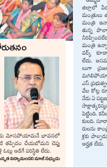
ఉమ్మడి నల్లగొండ జిల్లాలో పేరుకు ఇద్దరు మంత్రులు ఉన్నారు. నీళ్లు మంత్రి ఉన్నా ఎండిపోతున్న పొలాలకు చుక్క నీరిప్పించలేదు. రోడ్ల మంత్రి ఉన్నా ఒక ప్యాన్ వల్ల కూడా చేయించలేదు. అసమర్థ మంత్రులు ప్రజల ముందు మిగిలిపోయారు. బీఆర్ఎస్ ప్రభుత్వంలో జిల్లాలో ఒకే ఒక మంత్రి జగదీశ్వర్ రెడ్డి ఉండి వేల కోట్ల రూపాయలతో ఎన్నో అభివృద్ధి పనులు చేశారు. నేడు ఏ పట్టణం, ఏ పల్లెటూ వెళ్లినా నాడు చేసిన ప్రగతి పనులు నాశనమవుతున్నాయి. కాంగ్రెస్ ప్రభుత్వం అభివృద్ధిని పక్కన పెట్టింది. కనీసం మొక్కలకు నీళ్లు పోయించలేని దుస్థితి ఆ పాలకులది. సూర్యాపేటతోపాటు పలుచోట్ల వ్యాపారులు, అధికారులను కాంగ్రెస్ పార్టీ నాయకులు బెదిరించి అక్రమ వసూళ్లు పాల్పడుతున్నారు. అవినీతికి పాల్పడి వారికి ఓట్లు కలిగిస్తారు.