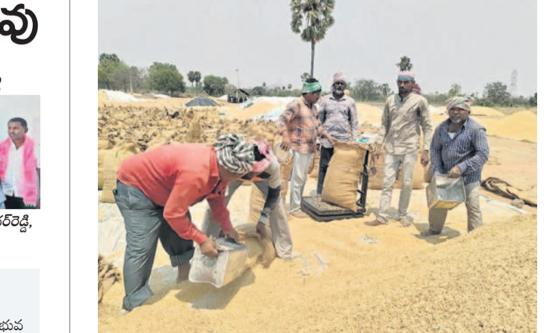
రెడ్డి కాలనీలోని కొనుగోలు కేంద్రంలో ధాన్యం కాంటా వేస్తున్న భూమిలీలు

ఈ నెల 22న బీఆర్ఎస్ భువనగిరి ఎంపీ అభ్యర్థిగా నామినేషన్ చేయనున్నట్లు ఆ పార్టీ అభ్యర్థి క్యాంపు మల్లేశ్ అన్నారు. ఉదయం 10 గంటల నుంచి 11 గంటల మధ్య యాదాద్రి లెక్కపర్చింపా నామినేషన్ దరఖాస్తులను ఉపాధ్యక్షులు తరఫున పాస్ చేశారు. కాంగ్రెస్ కు ప్రజల్లోకి వెళ్లి ఓట్లు అడిగి పరీక్షింపాలి.