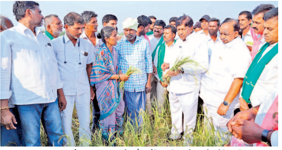
మహిళా రైతుతో మాట్లాడుతున్న మాజీ ఎంపీ వినోద్ కుమార్, మాజీ ఎమ్మెల్యే సతీశ్ కుమార్