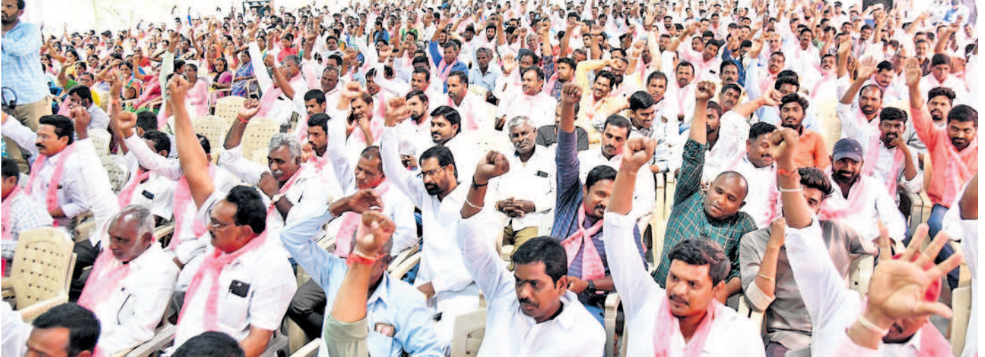
పెద్దకొడూరులో సన్నాహక సమావేశానికి హాజరైన నాయకులు, కార్యకర్తలు