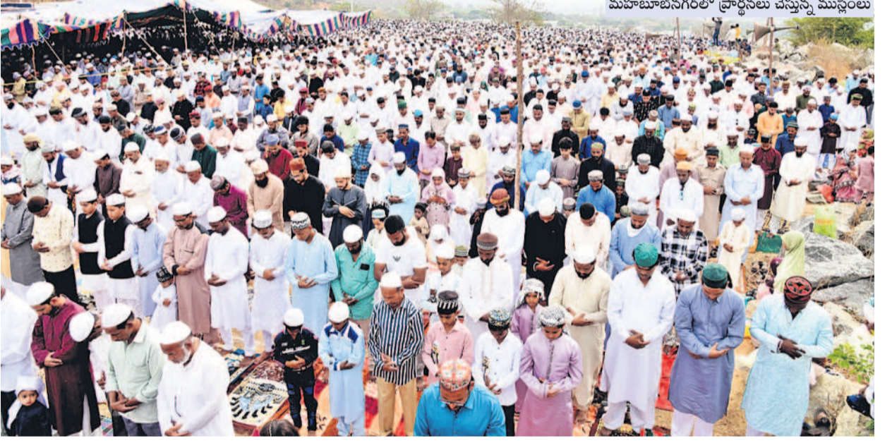
మహబూబ్ నగర్ లో ప్రార్థనలు చేస్తున్న ముస్లింలు

చర్యలతో సర్దుబాటు వైద్యశాలల్లోనే కాన్స్యులు జరుగుతున్న విషయం తెలిసింది. ఫిబ్రవరి, మార్చిలోని ప్రభుత్వ దవాఖానల్లో ప్రసవాల సంఖ్య రెండు నెలలుగా తగ్గుముఖం చూపింది. ఫిబ్రవరి, మార్చిలో సంఖ్య మరంత తగ్గింది. కారణాలేమైనా సర్దుబాటు దవాఖానల్లో డెలివరీలు సగానికి పైగా తగ్గడం కనిపిస్తున్నది. కాగా జనవరి నుంచి దవాఖానల్లో ఒక్కొక్క స్టాఫ్ సర్దుబాటు మాత్రమే విడుదలై ఉండడం కూడా మరో కారణంగా చెప్పొచ్చు.