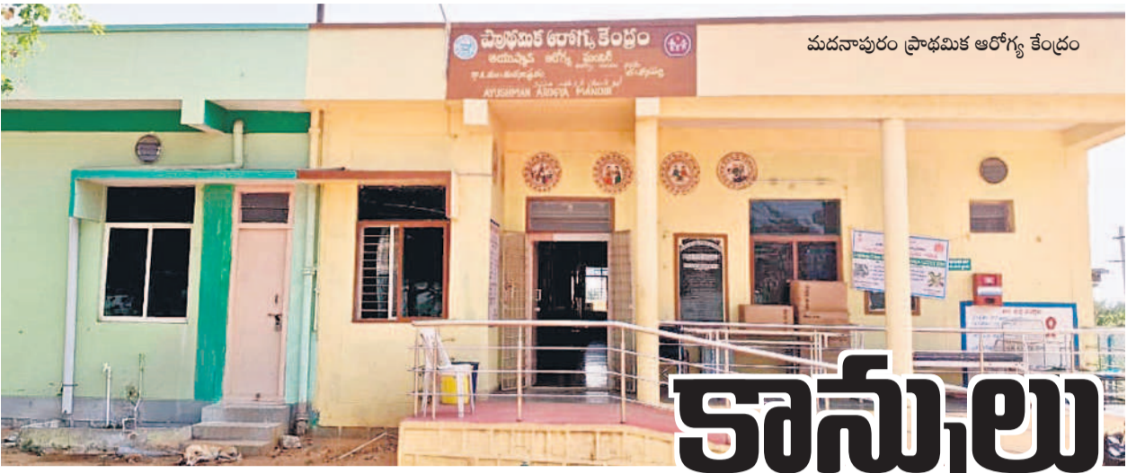
మదనాపూర్ ప్రాథమిక ఆరోగ్య కేంద్రం