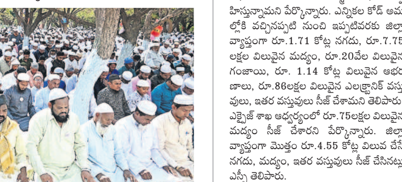
నల్లగొండలో ఈడ్గాలో ప్రార్థనలు చేస్తున్న ముస్లింలు