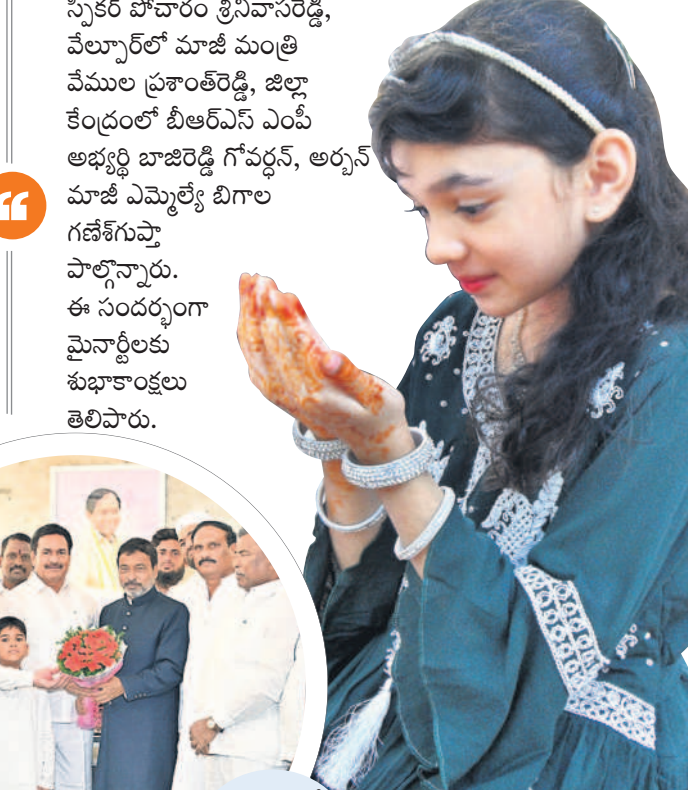
బాన్సువాడలో ముస్లింలకు శుభాకాంక్షలు తెలుపుతున్న పోచారం