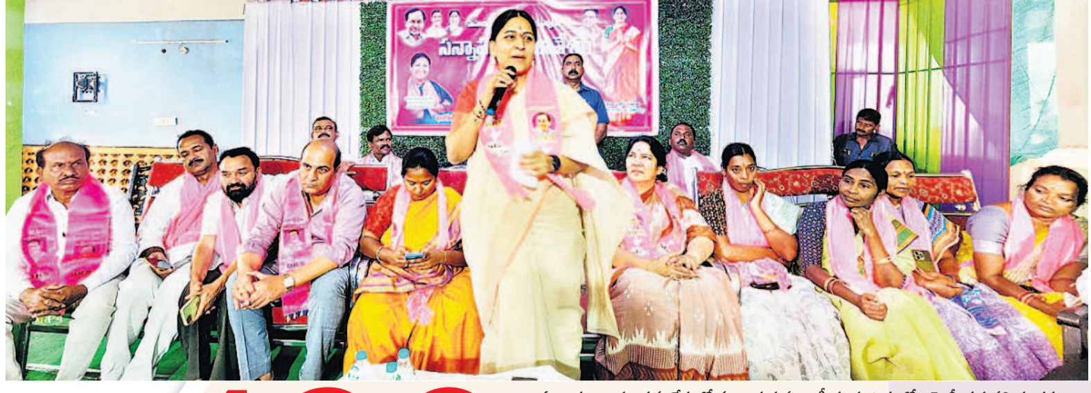
ఏటూరునాగారం: సమావేశంలో మాట్లాడుతున్న ఎంపీ కవిత, బిత్తూర్లో ఎమ్మెల్యే సత్యవతి తదితరులు

మంత్రి కొండా సురేఖకు బాధితుడి ఫిర్యాదు కరిమనాబాద్, ఏప్రిల్ 11: తన భూమిని కొండ్రం కాంగ్రెస్ నాయకులు కబ్బా చేసి అక్రమ నిర్మాణం చేపడుతున్నారని, పోలీసులకు ఫిర్యాదు చేసాను పట్టించుకోవడం లేదని బాధితుడు ఇక్కార గురువారం రాష్ట్ర అటవీ, దేవాలయ, పర్యాటక శాఖ మంత్రి కొండా సురేఖకు వినతిపత్రం అందజేశారు. గురువారం వరంగల్ ఫోన్ రోడ్ లోని కడపలో నిర్వహించిన రంజాన్ వేడుకల్లో మంత్రి పాల్గొన్నారు. ఈ క్రమంలో చింతలోని నర్సే నంబర్ 444లో గల 275 గజాల స్థలం కబ్బా చేశారని, తనకు న్యాయం చేయాలని ఇక్కార కోరారు. విచారణ చేసి కబ్బాదారులపై చర్యలు తీసుకోవాలని మంత్రి కొండా సురేఖ పోలీసులను ఆదేశించారు.