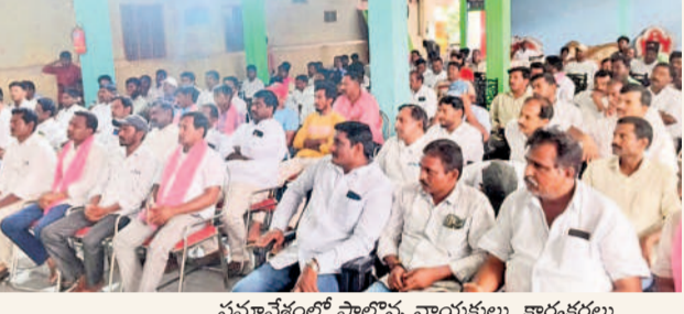
సమావేశంలో పాల్గొన్న నాయకులు, కార్యకర్తలు

ఏటూరునాగారం, ఏప్రిల్ 11 : అసెంబ్లీ ఎన్నికల ముందు హామీ ఇచ్చిన అరు గ్యారంటీలను అమలు చేయడంలో కాంగ్రెస్ ప్రభుత్వం విఫలమైందని బి.ఆర్.ఎస్. మాజీ నేతలు టి.ఆర్.ఎన్. మహబూబాబాద్ పార్లమెంట్ అభ్యర్థి, ఎంపీ మాల్ తో కవిత అన్నారు. అబద్ధపు హామీలతో అధికారంలోకి వచ్చిన ఆ పార్టీని ప్రజల్లో ఎండగట్టాలని పిలుపునిచ్చారు. గురువారం ఏటూరునాగారంలోని బీఆర్.ఎస్. హాల్లో ఏటూరు చేసిన మహబూబాబాద్ పార్లమెంట్ ఎన్నికల సన్మాన కార్యక్రమంలో ఆమె పాల్గొని మాట్లాడారు. ఎన్నికల సమయంలో 420 హామీలన్నీ, వంద రోజుల్లోనే నెరవేర్చుకోవని అధికారంలోకి వచ్చిన కాంగ్రెస్ పార్టీ, 120 రోజులైనా ఏ ఒక్క హామీ నిర్వహించిన అమలు చేయలేదన్నారు. కేసీఆర్ ప్రభుత్వంలో 24 గంటల నాణ్యమైన ఉచిత కలియజేపాటు పుష్కలంగా సాగు నీళ్లు ఉండడంతో ఎక్కడా ఎక్కడ పంట కూడా ఎండిపోలేదని, ఒక్క