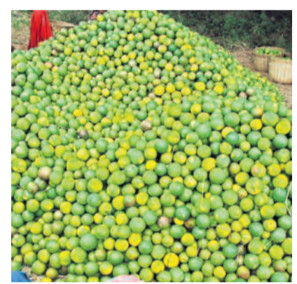
నల్లగొండ ప్రతినీడి, ఏప్రిల్ 11(నమస్తే తెలంగాణ)

నల్లగొండ జిల్లా బత్తాయి రైతులు సమస్యల సుడిగుండంలో కొట్టుమిట్టాడుతున్నారు. ఇప్పటికే కరువు పరిస్థితులతో తోటలను కాపాడుకునేందుకు అడ్డకట్టలు వదుతుండగా, మూలిగే నక్కపై తాటిపండు పడ్డట్లు మార్కెట్ మాయాజాలం మరింత కుంగిపోతోంది. బత్తాయి రేటు ఇటీవలే ఎన్నడూ లేనంతగా పడిపోయింది. వ్యాపారులు సిండికేటిగా మారి ధర పెంచడానికి సన్నీమిరా అంటున్నారు. దాంతో ఈ సీజన్లో ఒక్కో టన్ను బత్తాయిపై రైతులు రూ.15వేల నుంచి 20వేల వరకు నష్టపోతున్నారు. మార్కెట్ పరిస్థితులపై ప్రభుత్వ అజమాయిషీ లేకపోవడంపై రైతులు మండి పడుతున్నారు.