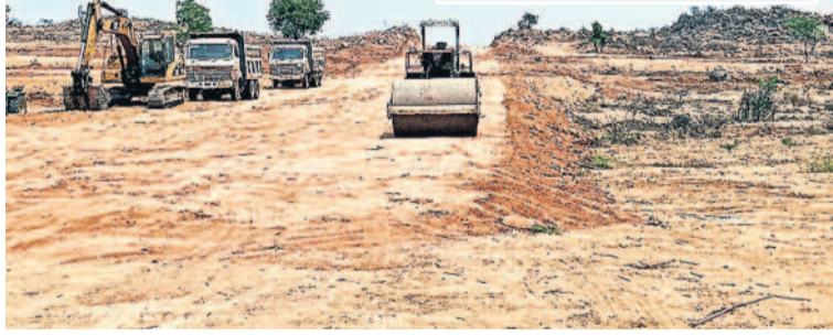
యాదగిరి గుట్ట : దాతాపల్లి సర్వేనంబర్ 291లో కొనసాగుతున్న స్థల అభివృద్ధి పనులు

యాదగిరి గుట్ట, ఏప్రిల్ 11 : న్యూనిహాసాగర్ జలాశయ నిర్మాణంలో ఇండ్లు, స్థలాలు కోల్పోయిన లబ్ధి నాయక్ తండా వాసులకు పునరావాసం కోసం గత ప్రభుత్వం కేటాయించిన స్థలంలో అభివృద్ధి పనులు సత్తవడకనే సాగుతున్నాయి. గతేడాది అక్టోబర్ 9న అభివృద్ధి పనులకు శంకుస్థాపన జరుగగా... ఈ ఏడాది ఫిబ్రవరిలోపు స్థలాన్ని అభివృద్ధి తీర్చిదిద్దే లబ్ధిదారులు ఇండ్లు నిర్మించుకునేందుకు మీలాగా అందిస్తామని పంచాయతీరాజ్ శాఖ అధికారులు, గుర్తీదారులు హామీ ఇచ్చారు. కానీ పనులు ఆ రేంజ్ లో జరుగడం లేదు. గత ప్రభుత్వం ఇచ్చిన హామీ మేరకు తమకు కేటాయించిన స్థలాన్ని అభివృద్ధి చేసి ఇవ్వాలని నిర్వాసితులు కోరుతున్నారు.