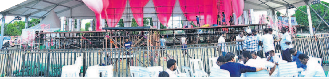
సభా ప్రాంగణంలో గులాబీ జెండాలు రెపరపలు

ఎమ్మెల్యేలు, ఎమ్మెల్యేలు, మాజీ ఎమ్మెల్యేలు, ఇతర ముఖ్యనేతలు సభ విజయవంతానికి అవార్గాల కృషి చేస్తున్నారు. 2 లక్షల మందికి పైగా సభకు తరలివచ్చే అవకాశం ఉందని పార్టీ శ్రేణులు హెచ్చరిస్తున్నాయి. ఎండ తీవ్రత నేపథ్యంలో సభకు వచ్చే వారికి ఎటువంటి ఇబ్బందులు తలెత్తకుండా అన్ని కార్యక్రమాలను తీసుకుంటున్నారు. మంచినీళ్లు