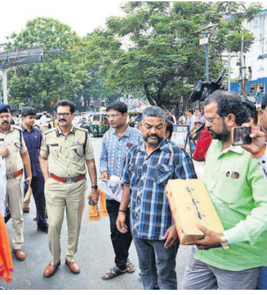
శోభాయాత్ర మార్చాన్ని పరిశీలిస్తున్న నగర సీపీ తీసుకున్నారు.