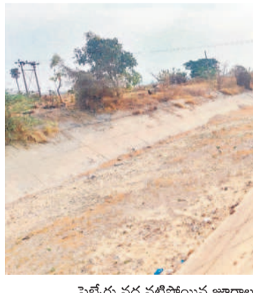
పెట్టేరు వద్ద వట్టిపోయిన జూరాల ప్రధాన ఎడమ కాల్వ

పెట్టేరు, ఏప్రిల్ 12 : ప్రయదర్శిని జూరాల ప్రాజెక్టు ప్రధాన ఎడమ (ఎన్టీఆర్) కాల్వ వట్టిపోయింది. ప్రతి వేసవిలో నీటి సరఫరా నిలిపివేసినా అక్కడక్కడా నీళ్లు కనిపించేవి. కానీ ఈ సారి మాత్రం చుక్క నీరు కూడా కనిపించడం లేదు. ఎండల నేపథ్యంలో ఈ పరిస్థితి దాపురించింది జూరాల ఆయకట్టు రైతులు అంటున్నారు. గద్వాల జిల్లా జూరాల డ్యాం నుంచి ప్రారంభమయ్యే ఈ కాల్వ వనపర్తి జిల్లా మీదుగా నాగర్ కర్నూల్ జిల్లా కొల్లాపూర్ వరకు ప్రయాణిస్తుంది. మూడు జిల్లాల పరిధిలో వేలాది ఎకరాలకు సాగునీరందిస్తూ రైతన్నకు వెన్నుదన్నుగా నిలుస్తున్న జూరాల ప్రధాన కాల్వ ప్రస్తుతం బోసిపోయి కనిపిస్తుంది. కృష్ణానదిలో నీటి జాడలు కరువై కళ్ల తప్పింది. కేసీఆర్ ప్రభుత్వంలో గతేడాది చచ్చని మూణాయిల్ దర్జనమిచ్చిన పొలాలు నేడు బీడు భూములుగా మారాయి. ఇప్పటికే జూరాల కింద క్రాపింగ్ చేసే ప్రకటించడంతో చచ్చని పైపు మాయమయ్యాయి.