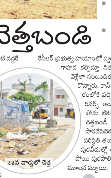
23వ వార్డులో చెత్త

జడ్చర్ల టౌన్, ఏప్రిల్ 12 : చెత్తమ్మా.. చెత్త.. ఓ ఐంటి వద్దకి చెత్తబండి వచ్చిందమ్మా.. తడిచెత్త పోడిచెత్త వేరు చేసి చెత్తబండిలో వేయడంమ్మా.. అంటూ నాలుగు నెలల వరకు జడ్చర్ల మున్సిపాలిటీలోని ప్రతి గృహిణీ అధికారిని బండ్లపాల్ల పాల్ల పురపాలక కార్యాలయం వద్ద తుప్పనడుతున్నాయి. రెండేండ్ల కిందట రూ.24 లక్షల నిధులతో అదనంగా 3 ట్రాలీ ఆటోలు, 3 ట్రాక్టర్లను చెత్త సేకరణకు అధికారులు కొనుగోలు చేశారు. దీంతో మున్సిపాలిటీలోని 27 వార్డులకూనూ ప్రస్తుతం చెత్తసేకరణ కొనసాగింది. 6 ట్రాక్టర్లు ఉన్నాయి. అయితే ప్రస్తుతం 10 ఆటోలు, 6 ట్రాక్టర్లు మాత్రమే నిత్యం చెత్తను సేకరిస్తున్నాయి. మిగతావి రిపేర్ కు గురయ్యాయి. వాహనాలు తక్కువగా ఉండడంతో పట్టణంలో రెండు, మూడోజాతాల చెత్తను సేకరిస్తున్నట్లు స్థానికులు ఆరోపిస్తున్నారు. పాతబయ్యలను కేటాయింబిన రెండు ఆటోలు చెడిపోవడంతో ఆ ప్రాంతంలో చెత్త రోడ్లపై వేస్తున్నారు. నేతాజీ కూడలి నుంచి రెండు దూరంగా ప్రాంతంలో దుకాణదారులు సైతం చెత్తలో రోడ్లను నింపేస్తున్నారు. చెత్త బండ్లు చాలా కాలినీడోకి రావడంతో ప్రజలు వ్యర్థాలను రోడ్లపై వేస్తున్నారు.