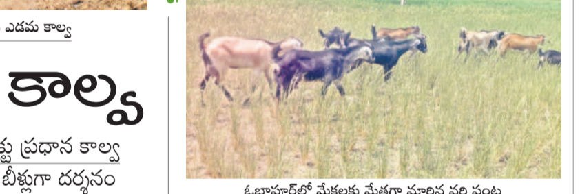
ఓబ్లాపూర్ లో మేకలకు మేతగా మారిన పరి పంట