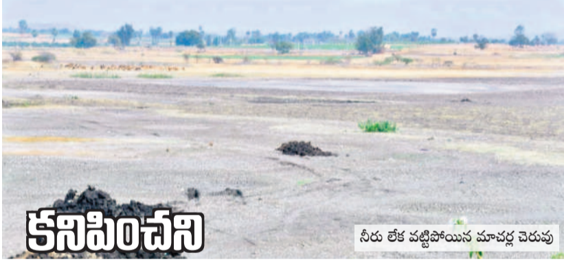
నీరు లేక వట్టిపోయిన మాచర్ల చెరువు