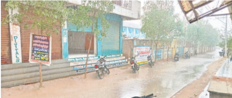
అచ్చంపేటలో కురుస్తున్న వర్షం