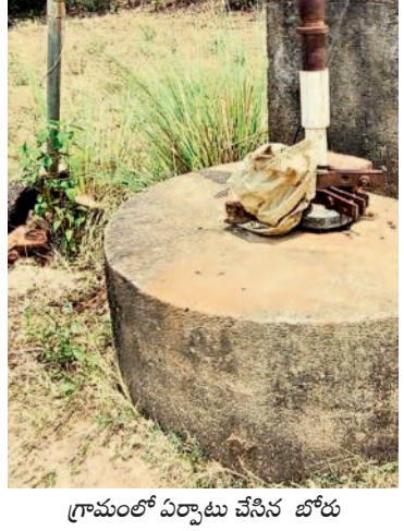
గ్రామంలో ఏర్పాటు చేసిన బోరు