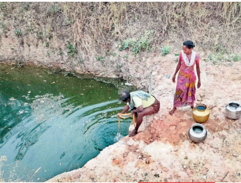
బయ్యారం, ఏప్రిల్ 12: తాగునీటి కోసం బయ్యారం మండలం నాచులపాడు ప్రజలు అరిగోస పడుతున్నారు. గ్రామంలో సుమారు 120 ఇండ్లు ఉండగా, 350 జనాభా ఉంది. కొద్ది రోజులుగా గ్రామానికి తాగునీటి సరఫరా సరిగా లేక ప్రజలు తీవ్ర ఇబ్బందులు పడుతున్నారు. ఇక్కడి భూమి పొరల్లో బొగ్గు నిల్వలు ఉన్నాయి. దీంతో బోర్లు వేసినా నీరు సరిగా పడవు. పడినా ఆ నీరు సవరు, బిలుము వాసనతో ఉంటాయి. ఈ నీరు ప్రజలు అవసరాలకు ఉపయోగించేలా ఉండవు. దీంతో మిషన్ భగీరథ నీరు గానీ, గ్రామానికి రెండు కిలోమీటర్ల దూరంలో జిన్నాలవారు వద్ద బోరు వేసి గ్రామానికి పైపులైన్ ద్వారా నీరు సరఫరా అయ్యేది. ఈ నీటిని ఇన్స్టాల్ చేసి తాగునీరు, వివిధ అవసరాలకు ఉపయోగించుకునేవారు. కానీ కొద్ది రోజులుగా నీటి సరఫరా సరిగా లేక ప్రజలు సరకయతన పడుతున్నారు. భూగర్భ జలాలు తగ్గడంతో గ్రామ శివారులోని బోరులో నీటి లభ్యత పూర్తిగా లేదు. ఈ క్రమంలోనే మూడు రోజులుగా మిషన్ భగీరథ నీరు సరఫరా కావడంలేదు. దీంతో స్థానికులు తాగునీటికి అవస్థలు పడుతున్నారు. ఊరు పక్కనున్న వాగులో కొందరు కలుషిత నీటిని తాగునీటి కోసం ఉపయోగిస్తున్నారు. మరికొందరు పక్కనున్న కొత్తపేట, గంధంపల్లికి వెళ్లి తాగునీటిని తెచ్చుకుంటున్నారు. గ్రామ పంచాయతీ సిబ్బంది గంధంపల్లి, కొత్తపేట గ్రామాల నుంచి సిబ్బందికడ ద్వారా నీటిని తీసుకువచ్చి సరఫరా చేస్తున్నా అవి సరిపోక మహిళలు నీటి కోసం బిందెలు, క్యాన్లతో సుదూర ప్రాంతాలకు వెళ్లి తెచ్చుకుంటున్నారు. సమీప వాగులు, వ్యవసాయ బావుల వద్దకు వెళ్లి స్నానాలు చేసి, అక్కడే బట్టలు ఉడుక్కుంటున్నారు. నీటి కొరత వచ్చినప్పుడు అధికారులు హడావుడిగా తాత్కాలికంగా ఏర్పాట్లు చేస్తున్నారు. శాశ్వత పరిష్కారాన్ని ఆలోచించడంలేదు. పైగా ఈసారి వేసే దృష్ట్యా ముందస్తుగా ఎలాంటి చర్యలు చేపట్టకపోవడం వల్లే ప్రస్తుతం తాము నీటి కోసం చాలా ఇబ్బందులు పడుతున్నామని ప్రజలు ఆవేదన వ్యక్తం చేస్తున్నారు. ఇప్పటికైనా ఉన్నతాధికారులు స్పందించి నీటి సమస్యను పరిష్కరించాలని గ్రామస్థులు కోరుతున్నారు.