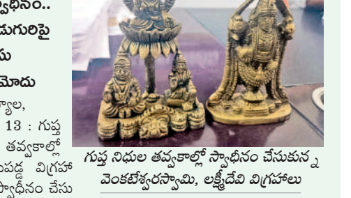
గుప్త నిధుల తవ్వకాల్లో స్వాధీనం చేసుకున్న వెంకటేశ్వరస్వామి, లక్ష్మీదేవి విగ్రహాలు