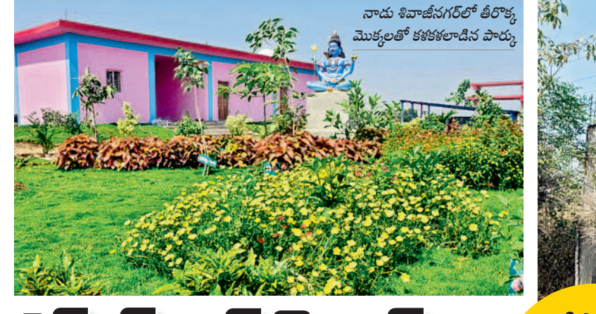
నాడు శివాజీనగర్లో తీర్మానం మొక్కలతో కళకలాపాన్ని పాటు

■ ఎక్స్ కవేటర్లతో అక్రమంగా మట్టి తవ్వకాలు ■ మత్స్యకారులు, పశువులకు ప్రమాదకరం ■ ఇరిగేషన్, రెవెన్యూ అధికారుల నిర్లక్ష్యం నర్సింహాలపేట, ఏప్రిల్ 13: చెరువుల్లో ఎక్స్ కవేటర్లతో అక్రమంగా మట్టి తవ్వకాలు జోరుగా సాగుతున్నాయి. చెరువు మట్టి, మొర్రా తవ్వకాలతో చెరువులలో తవ్వకాలతో, ఇరిగేషన్ అధికారుల అనుమతులు తీసుకోకుండా కుంటుంది. కానీ మండలకేంద్రమైన నర్సింహాలపేట, పడమటిగూడెం, కొమ్ముల వంశ గ్రామంలోని చెరువులు, కుంటల్లో ఇప్పటికీ అక్రమంగా మట్టి తవ్వకాలు జరుగుతున్నాయి. కొందరి కొడుకులు.. ఫలితంగా అక్కడ ఏర్పడిన భారీ గుంతలు మత్స్యకారులు, పశువులకు ప్రమాదకరంగా మారుతున్నాయి. అభివృద్ధి పనుల పేరుతో అక్రమార్కులు మట్టిదా సాగుస్తున్నా ఇరిగేషన్, రెవెన్యూ, పంచాయతీ అధికారులు తెలిసి కూడా నిర్లక్ష్యంగా వ్యవహరిస్తున్నారనే ఆరోపణలు ఉన్నాయి. తహసీల్దార్ నాగరాజును వివరణ కోరగా తాము ఎవరికీ అనుమతి ఇవ్వలేదని, ఎవరైనా అక్రమంగా చెరువు మట్టి తరలిస్తే చర్యలు తప్పవని చెప్పారు.