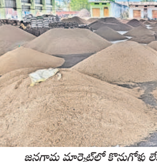
జనగామ మార్కెట్లో కొనుగోళ్లు లేక వేరుకుపోయిన ధాన్యం నిల్వలు

అడ్డదారులతో చర్చలు జరిపారు. ఈ సందర్భంగా వ్యాపారులు తమపై ప్రభుత్వం పెట్టిన అక్రమ కేసులను ఉపసంహరించుకోవాలని డిమాండ్ చేశారు. ఇప్పటివరకు ఈ-నామ్ ప్రకారం కొనుగోలు చేస్తున్నామని అధికారులకు తెలిపారు. వేసవి సీజన్ లో ఆకాల వర్షాలు కురుస్తున్నాయి. అరబిట్టు ధాన్యం మార్కెట్ తీసుకోవడం దండం తాలు, గడ్డి వస్తున్నందున ఈ-నామ్ ప్రకారం కొనుగోలు చేస్తున్నామని వ్యాపారులు తెలిపారు. ధాన్యం కొలిక్కిరాని కొనుగోలు చేస్తున్నామని తెలిపారు. ఎంపీఎస్ చెల్లింపడం సాధ్యపడదన్నారు. జనగామ రూరల్, ఏప్రిల్ 13: జనగామ వ్యవసాయ మార్కెట్లో మూడు రోజులుగా ధాన్యం కొనుగోలు నిలిచిపోయాయి. ధాన్యానికి మధ్యకు ధర విషయమై ట్రేడులు, వ్యాపారులకు మధ్య జరిగిన చర్చలు విఫలమయ్యాయి. ఉమ్మడి వరంగల్ జిల్లా మార్కెటింగ్ శాఖ డిడి రాజానాయక్ శనివారం జనగామ మార్కెట్లో చేరుకొని ట్రేడర్లు, వ్యాపారులతో చర్చలు చేపట్టారు. ఆరబిట్టు ధాన్యం మార్కెట్ తీసుకోవడం దండం తాలు, గడ్డి వస్తున్నందున ఈ-నామ్ ప్రకారం కొనుగోలు చేస్తున్నామని వ్యాపారులు తెలిపారు. ధాన్యం కొలిక్కిరాని కొనుగోలు చేస్తున్నామని తెలిపారు. ఎంపీఎస్ చెల్లింపడం సాధ్యపడదన్నారు. జనగామ మార్కెట్లో కొనుగోళ్లు లేక వేరుకుపోయిన ధాన్యం నిల్వలు