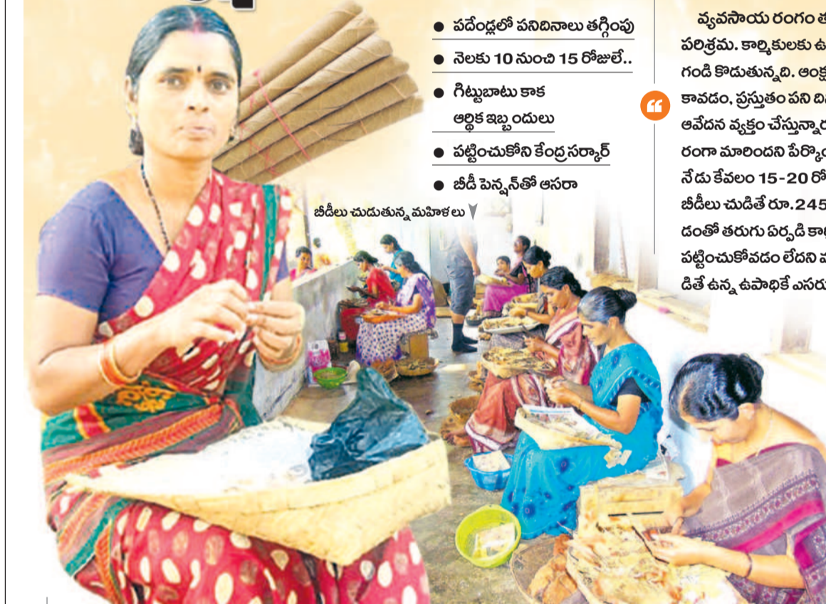
బీజీ చురుకును మహిళలు