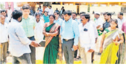
కొనుగోలు కేంద్రాల్లో పరిశీలనలు, కర్షక