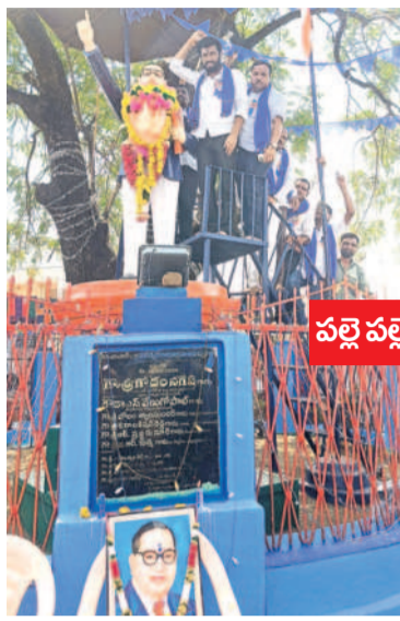
వల్లె వల్లెనా అంబేద్కర్ జయంతి

నమస్తే : ఆరు గ్యాంటెట్ కాంగ్రెస్ ప్రచారం చేస్తున్నది. ప్రజలు ఓట్లు వేస్తారా? సక్కు : అసెంబ్లీ ఎన్నికల్లో ఆరు గ్యాంటెట్ పేరు వెచ్చి కాంగ్రెస్ నమ్మక ద్రోహానికి పాల్పడింది. ఉచిత బస్సు ప్రయాణంతో ఆలోచించుకుంటున్న ప్రభుత్వం కోల్పోయి అభ్యుత్థులు చేసుకుంటున్న ప్రభుత్వం పట్టించుకోవడం లేదు. గృహజ్యోతి అర్జున్ వారం దరికి చేరడం లేదు. రూ.5000 నిలిండ్ల ఎవరికి రావడం లేదు. రూ.2 లక్షల రుణం మాఫీ లేదు. సాగునీరు లేక రైతులు అభ్యుత్థులు చేసుకుంటున్నారన్నారు. ఆ పార్టీ నాయకులు పరమార్థం చినా పాపాన పోలేదు. తాగునీటి కోసం ప్రజలు ఇబ్బందులు పడుతున్నారన్నారు. ప్రత్యేకాధికారుల పాలనలో పల్లెల్లో సమస్యలు రాజ్యమేలుతున్నాయి. పాత హామీలను పక్కన పెట్టిన కాంగ్రెస్ ఎంపీ ఎన్నికల్లో కొత్తగా మ్యూనిసిపల్ కార్పొరేషన్ విడుదల చేయించింది. కాంగ్రెస్ పార్టీకి ఈ ఎన్నికల్లో ప్రజలే బుద్ధి చెబుతారు.