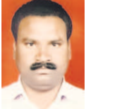
రాజన్న బీజీ కార్మిక సంఘం నాయకులు.

బీజీ పరిశ్రమపై కేంద్ర ప్రభుత్వం చిన్న చూపు చూస్తున్నది. కేంద్ర కార్మిక శాఖ కార్మికులకు ఉపాధి అవకాశాలు పెంచేలా చట్టాలను తగ్గించి అమలు చేయాలి. కానీ కార్మిక చట్టాలు నుంచి తప్పుపడేలా చూస్తున్నారన్నారు. కేసీఆర్ ప్రభుత్వం అమలు చేసిన పథకాలను తెలియజేసి ఓట్లు అడుగుతాం. పార్లమెంట్ లో బీజీ, కాంగ్రెస్ పార్టీలకు తెలంగాణ గొంతు విన్నవించాలి. తెలంగాణ హక్కుల సాధన, ప్రజల సమస్యల పరిష్కారానికి కేవలం బీఆర్ఎస్ ఎంపీలు మాత్రమే ప్రజల గొంతును వినిపిస్తారు.