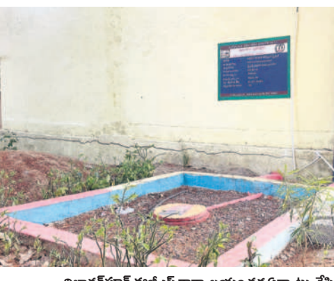
దివాలపూర్ ఈజీఎస్ కార్యాలయం వద్ద ఏర్పాటు చేసిన ఇంకదు గుంత

ప్రభుత్వ కార్యాలయాలు, ఇతర ప్రభుత్వ స్థలాల్లో మాత్రం ఇంకదు గుంతలను ఏర్పాటు చేశారు. కానీ.. ఇంటి వద్ద మాత్రం ఇంకదు గుంతలు కానరావడం లేదు. గతేడాది రికార్డుస్థాయిలో 5,940 ఇంకదు గుంతల నిర్మాణం చేపట్టారు. ఈ నిర్మాణ పనుల కోసం జిల్లాస్థాయి అధికారులు మొదలకు నుండి స్థాయి అధికారులందరూ అన్ని కార్యాలయాల్లో నిర్మించుకున్నారు. ఈ నిర్మాణాలకు డిఆర్డీవో ఆధ్వర్యంలో ఉద్యమలలో చి ది రెయిన్ వేరిట కార్యక్రమం చేపట్టినప్పటికీ గ్రామీణ, పట్టణ ప్రాంత ప్రజలకు చేరడం లేదు. కచ్చితంగా నిర్మించుకోవాలి.. భూగర్భ జలాలు అడుగంటకుండా ముందు చూపుతో నూతన భవనాలు నిర్మించుకునే వారు తప్పని సరిగా ఇంకదు గుంతను నిర్మించుకో