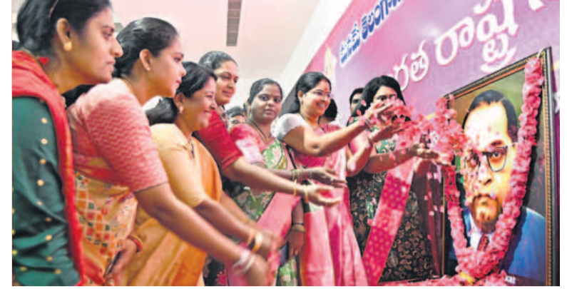
ఆదివారం తెలంగాణభవన్లో రాజ్యాంగ నిర్మాత డాక్టర్ బీఆర్ అంబేద్కర్ చిత్రపటానికి నివాళులర్పిస్తున్న బీఆర్ఎస్ మహిళా నేతలు