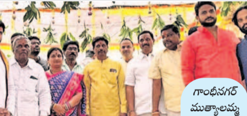
గాంధీనగర్ ముత్యాలమ్మ ఆలయంలో కార్పొరేటర్ పావని