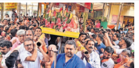
విక్రమపల్లి వేంకటేశ్వర్ స్వామి ఆలయంలో సీతారామ కల్యాణంలో భాగంగా పల్లకీ సేవ..