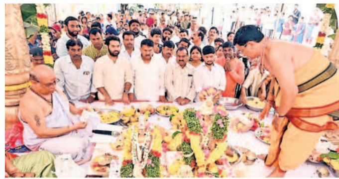
విక్రమపల్లి : శ్రీ అంజనేయ స్వామి ఆలయ ప్రాంగణంలో జరిగిన సీతారాముల కల్యాణ మహోత్సవంలో పాల్గొన్న ముషీరాబాద్ ఎమ్మెల్యే ముతాగపాటి