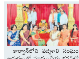
కార్యాలయంలో పద్మశాలి సంఘం అధ్యక్షులలో హార్షుడు భవన్లో నిర్వహించిన శ్రీరామ నవమి వేడుకల్లో పాల్గొన్న ప్రతినిధులు