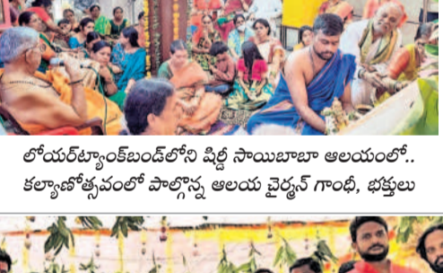
లోయర్ట్యాంట్ బెండ్లోని పీల్ సాయిబాబా ఆలయంలో.. కల్యాణోత్సవంలో పాల్గొన్న ఆలయ చైర్మన్ గాంధీ, భక్తులు