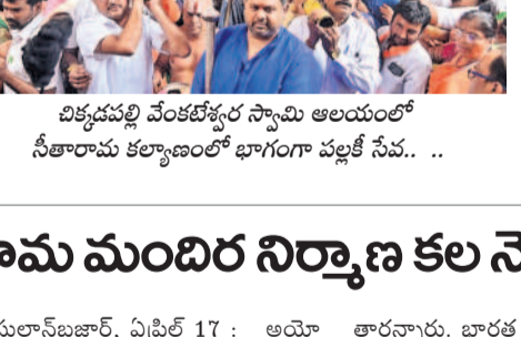
విక్రమపల్లి వేంకటేశ్వర్ స్వామి ఆలయంలో సీతారామ కల్యాణంలో భాగంగా వల్లకే సేవ..