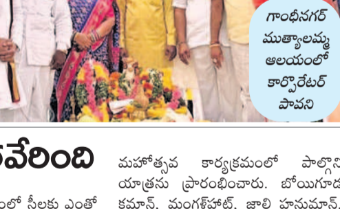
గాంధీనగర్ ముఖ్యమంత్రి ఆలయంలో కార్వోలేటి పావని