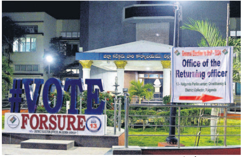
నల్లగొండ కలెక్టరేట్లో పూర్వయిన ఏర్పాట్లు