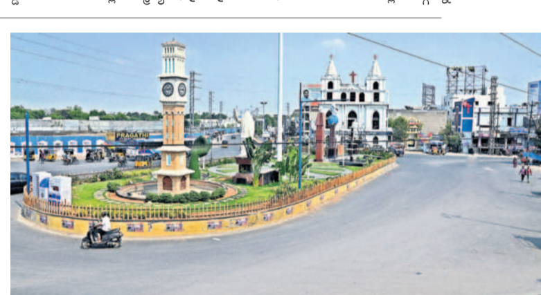
బుడవారం మధ్యాహ్నం నిర్మాణస్థంగా నల్లగొండలోని క్షాత్రవర్ సెంటర్