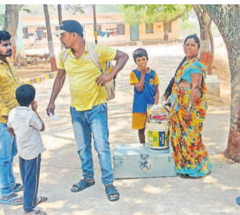
హాస్పల్ నుంచి విద్యార్థులను ఇంటికి తీసుకెళ్లను తల్లిదండ్రులు

పోవడం, సరైన భోజనం పెట్టకపోవడం, ఆరోగ్యం గురించి పట్టించుకునేవారు లేక బయటి వ్యక్తులను ఇంట్లోకి రావడం, యాజమాన్యం బయటి వ్యక్తులకు అప్పగించడంతో విద్యార్థులు అత్యున్నత హత్యలు చేసుకుంటున్నారు. వైపుబ్బం లేని సిబ్బందితో వంటలు చేయించడంతో పుడ్ పాలు జన్ కేసులు నమోదవుతున్నాయి. ఇప్పటికే జిల్లాలో కలుషిత ఆహారం కారణంగా బోమలూరామారం, గుండాల, భువనగిరి, వలిగొండ, మోటకొండూరు వసతి గృహాల్లోనూ పుడ్ పాలు జన్ కేసులు నమోదయ్యాయి.