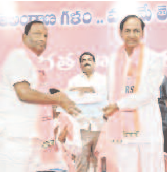
బీఆర్ఎస్ పెద్దపల్లి ఎంపీ అభ్యర్థి కొప్పుల చాళురీకు బీఫామ్ అందజేస్తున్న అధినేత కేసీఆర్