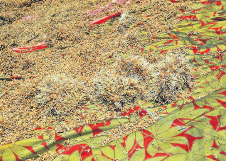
కామారెడ్డి మండలం క్యాంపస్ లో అరబోసిన వడ్లకు వచ్చిన మొలకలు