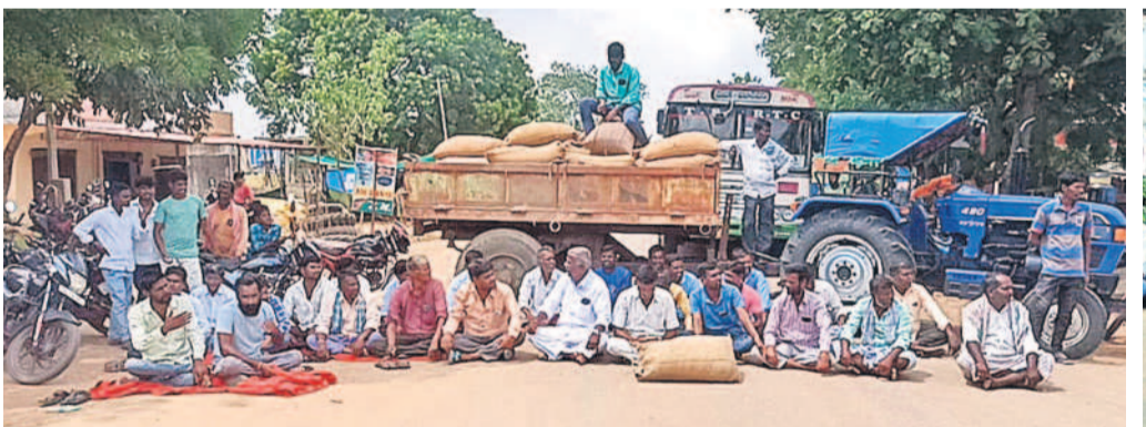
మెదక్ జిల్లా కొల్లూరం మండలం దుంపలకుంటలో ధాన్యం బస్సాలతో రాస్తారోకో చేస్తున్న రైతులు

అడిగి తెలుసుకోవాలని అన్నారు. కాంగ్రెస్ ప్రభుత్వ తీరును ఎండగట్టాలని రులను సమస్యలను చేస్తూ వడ్లు కొనేలా మాడాలని కోరారు. తడిసిన ధాన్యం కొనుగోలు చేసేలా ప్రభుత్వంపై ఒత్తిడి చేయాలన్నారు. బీఆర్ఎస్ ప్రభుత్వంలో చివరి గింజ వరకు కొనుగోలు చేసిన విషయాన్ని గుర్తుచేశారు. కొనుగోలు విషయంలో ఎక్కడ ఇబ్బంది వచ్చినా తన అక్కడి రైతులతో మాట్లాడి సమస్యలను