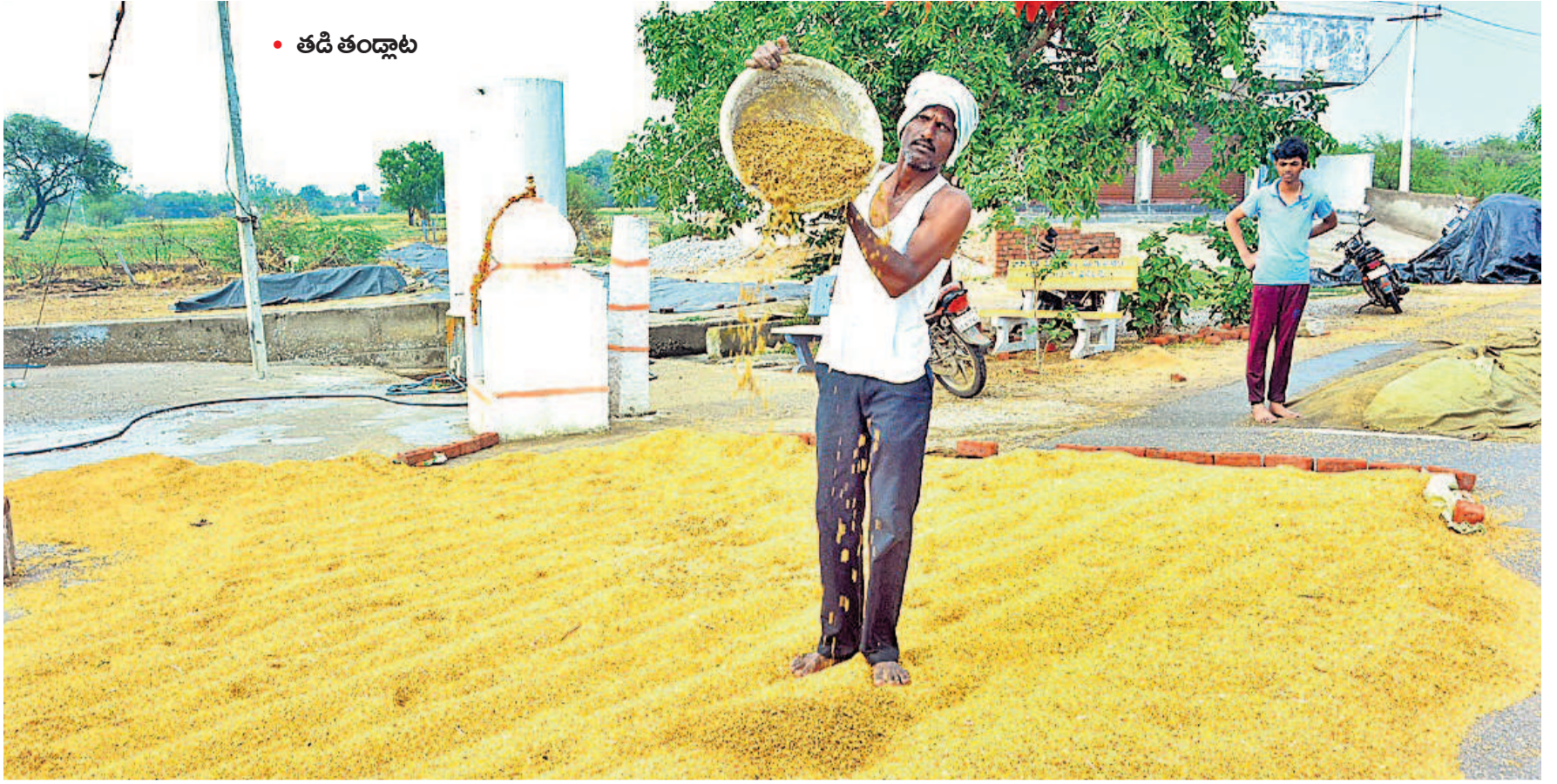
• తడి తండ్లాట

భూపాలపల్లి జిల్లా నగరంపల్లిలో నీటి మునిగిన వరిపంటను చూపుతున్న మహిళా రైతు