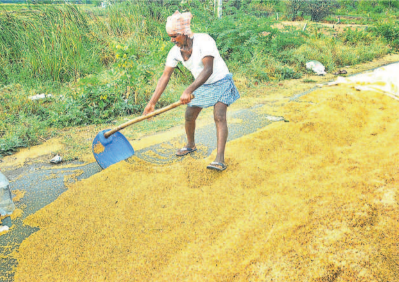
నంగారెడ్డి జిల్లాలో వర్షానికి కొట్టుకుపోయిన ధాన్యాన్ని కుప్ప చేస్తున్న రైతు