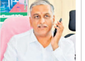
దీనికొన్న రెస్పాన్స్ లో మాట్లాడుతున్న ఎమ్మెల్యే హరీశ్ కౌటా

సిద్దిపేట, మే 18 : రైతులకు కష్టకాలంలో అండగా నిలువాలని, చివరి గింజా కొనే వరకు రైతుల పక్షాన పోరాడుదామని మాజీ మంత్రి, సిద్దిపేట ఎమ్మెల్యే తన్నీరు హరీశ్ కౌటా పిలుపునిచ్చారు. శనివారం ఆయన సిద్దిపేట నియోజకవర్గ ప్రజాప్రతినిధులకు, బీఆర్ఎస్ శ్రేణులతో దీనికొన్న రెస్పాన్స్ నిర్వహించారు. ఈ సందర్భంగా ఆయన మాట్లాడుతూ.. అన్నదాతలను ఆగం చేస్తూ అరిగేసే పెడుతున్న కాంగ్రెస్ ప్రభుత్వంపై రైతుల పక్షాన పోరాటం చేయాలని సూచించారు. రోజుకోమాట మారుస్తూ మోసం చేస్తున్న కాంగ్రెస్ ప్రభుత్వ తీరును ఎండగట్టాలని కోరారు. వడ్లకు కాంగ్రెస్ ఇస్తానన్న రూ.500 బోనస్ పై రైతులకు న్యాయం చేసే వరకు పోరాటం దేదామని పిలుపునిచ్చారు. కొనుగోలు కేంద్రాలను సుదీర్ఘంగా రద్దీం చేయాలన్నారు. బీఆర్ఎస్ ప్రభుత్వంలో చివరి గింజ వరకు కొనుగోలు చేసిన విషయాన్ని గుర్తుచేశారు. కొనుగోలు విషయంలో ఎక్కడ ఇబ్బంది వచ్చినా తన అక్కడి రైతులతో మాట్లాడి సమస్యలను