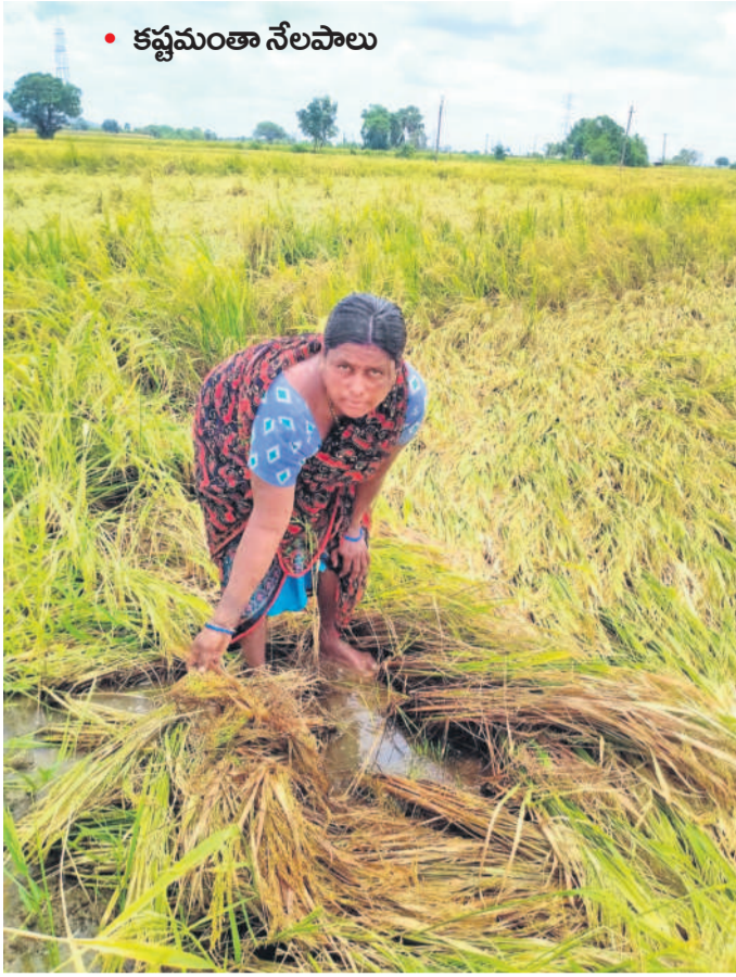
• కష్టమంతా నేలపాలు