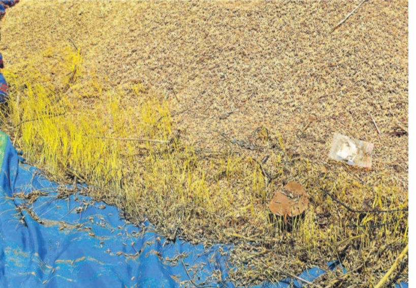
కామారెడ్డి జిల్లాలో అరబోసిన వడ్లకు వచ్చిన మొలకలు