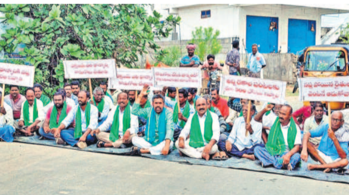
జగిత్యాల జిల్లా నర్సంపాలపల్లిలో ధర్మా చేస్తున్న బీఆర్ఎస్ నాయకులు, రైతులు