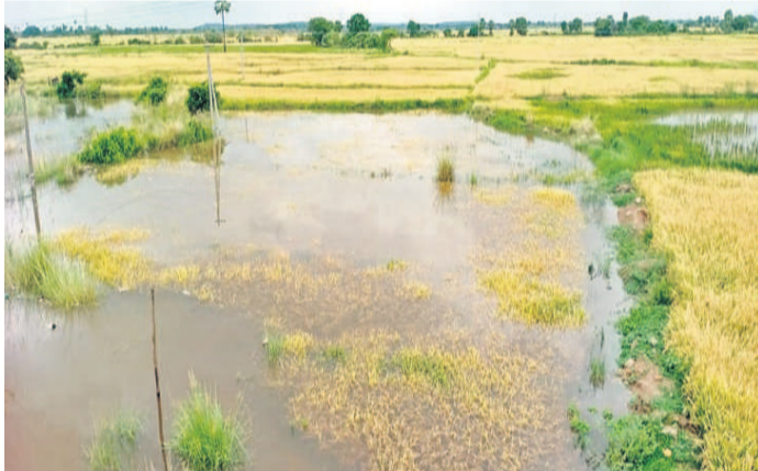
ఇయశంకర్ భూపాలపల్లి జిల్లా గణపూరం మండలం కేంద్రం శివారులో మోరంపాడు వాగు వరద నీటిలో మునిగిన వరి పొలం

నీరు వచ్చి చేరింది. మూడు రోజులుగా కురుస్తున్న భారీ వర్షాలకు ఇయశంకర్ భూపాలపల్లి జిల్లా గుణపురం మండలంలోని సీతారాం పురం, వెల్లుపల్లి గ్రామాల మధ్యలోని మోరంపాడు వాగు ఉధృతంగా ప్రవహిస్తున్నది. వాగు పరిసర ప్రాంతాల్లోని వరి పంట పొలాల నీటి మునిగాయి. నెలవాలిన వరిపంట చేతి కండ్ల దశలో నీటిలోనే మొలకెత్తడంతో రైతులు ఆందోళన చెందుతున్నారు. మరో 20 రోజుల్లో కోతలు పూర్తి చేసి ధాన్యాన్ని విక్రయించే సమయంలో వర్షాలు తమ పాలిట శాపంగా మారాయని రైతులు ఆవేదన వ్యక్తం చేస్తున్నారు. గణపూరం మండలం కేంద్రంలోపాటు కొండాపూర్, ధర్మారావుపేట, నగరంపల్లి, చెల్లూర్, బుద్ధారం, మైలారం వంటి పంట నీటి మునిగడంతో రైతులకు కొలేని దెబ్బ తగిలింది.