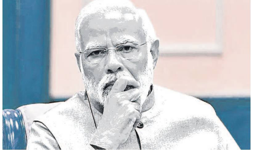
అదురవుతున్న విమర్శలను ఇక ఇప్పటిస్థాయిలో అయినా లెక్కపెట్టవలసిన అవసరం ఉండదు.

సర్ది ఇక్కడే సమస్యకు మూలం ఉన్నట్లు కనిపిస్తున్నది. గెలుపంటి మాట సరేనని కాక, 400 సీట్లు సాధించటాన్ని లక్ష్యాన్ని మోదీ తనకు తాను ఒక మహా ప్రతిష్టాకథనై నవ్వడంగా మార్చుకున్నట్లు కనిపిస్తున్నది. అదిగాని జరిగినట్లయితే దాని ప్రభావాలు పలు విధాలుగా ఉంటాయి. ప్రతిపక్ష కాంగ్రెస్ నేతల పాటు ఇండియా కూటమి దారుణంగా దెబ్బతినిపోతాయి. ఏ కూటమిలోనూ చేరని తల్లపై పార్టీలు బలహీనపడి నైతికంగా, రాజకీయంగా కుంగిపోతాయి. స్వాతంత్ర్యం లభించినప్పటి నుంచి గత 75 ఏళ్లలో ఏ పార్టీకి ఎప్పుడూ లేనంత భార్య బీజేపీకి పెరుగుతుంది. తామింకా అధికారంలో లేని రాష్ట్రాలలో అధికార సాధనకు మార్గం సుగమమవుతుంది. ముఖ్యంగా, ఇంతకాలం జనసంఘం గానీ, బీజేపీకి గానీ, సంఘపరివార్ గానీ కొరకరాని కొత్తగా మిగిలిన దక్షిణాది స్వాధీనమయే అవకాశం బహుశా లభిస్తుంది. పరిపాలనపరంగా, మతతత్వపరంగా