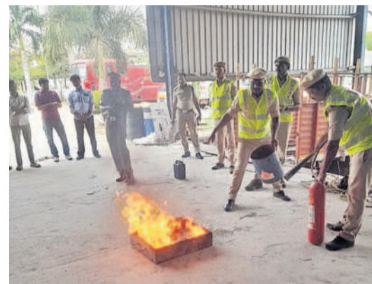
అగ్ని ప్రమాదాలపై అవగాహన కల్పిస్తున్న ఫైర్ ఫైట్స్ అధికారి