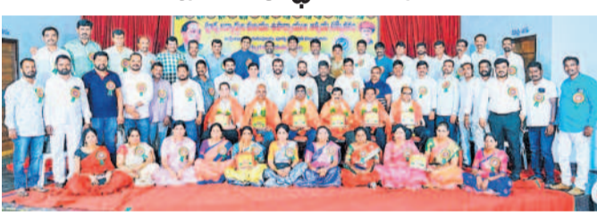
రంగాపూర్లో ఆత్మీయ సమ్మేళనంలో పాల్గొన్న పూర్వ విద్యార్థులు

మంచాల, ఏప్రిల్ 18 : మంచాల జిడ్పీసీఎస్ 1998-99 సంవత్సరానికి చెందిన 10వ తరగతి పూర్వ విద్యార్థుల సమ్మేళనం బుధవారం సాయంత్రం 6 ఫంక్షన్ హాల్లో జరిగింది. కేక్ కట్ చేసి ఆడుతూ పాడుతూ సందడి చేశారు. గజ్జాపకాలను గుర్తు చేసు