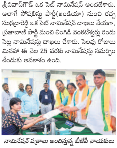
నామినేషన్ల పత్రాలు అందిస్తున్న బీజేపీ నాయకులు