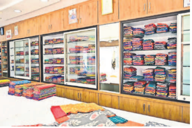
పోషకపదార్థ చేనేత సహకార సంఘంలో నిల్వ ఉన్న వస్త్రాలు

భూదాస్ పోషకపదార్థ, ఏప్రిల్ 18 : చేనేత సహకార సంఘాల పాలకపర్లాలు గడువు ముగిసి ఏండ్లు గడుస్తున్నా ఎన్నికలు నిర్వహించబడకపోవడంతో సంఘాల అభివృద్ధి కుంటుపడుతున్నది. పర్సన్ ఇన్ చార్జి అధికారులను నియమించడంతో చేనేత కార్మికులకు చేతినిండా పని కల్పించలేకపోతున్నారు. జిల్లాలో 2013లో చేనేత సహకార సంఘాలకు ఎన్నికలు జరుగా.. 2018 ఫిబ్రవరిలో పాలక పర్లాలు పదవీకాలం ముగిసింది. ప్రతి ఐదేండ్లకోసారి ఎన్నికలు నిర్వహించాల్సి ఉండగా.. 2018లో కొత్త పాలకర్లాలను ఎన్నుకోకుండా పర్సన్ ఇన్ చార్జిలను నియమించారు. అప్పటి నుంచి అధికారుల పాలన కొనసాగుతుండటంతో సంఘాల్లో కార్మికులకు పని కల్పించడం లేదు.