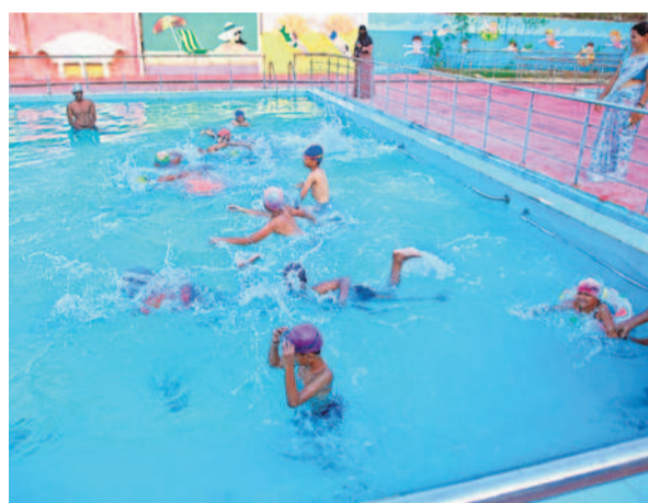
ఎండకు తాళలేక నల్లగొండలోని స్విమ్మింగ్ పూల్ లో ఈత కొడుతున్న చిన్నారులు