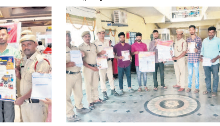
కామారెడ్డిలో అవగాహన పోస్టర్లను ప్రదర్శిస్తున్న ఫైర్ అధికారులు

అగ్ని ప్రమాదాల నివారణకు తీసుకోవాల్సిన చర్యలను వివ