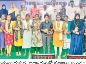
బహుమతులందుకున్న విద్యార్థులతో కళాశాల బృందం