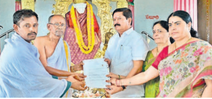
ఆలయంలో కుటుంబ సభ్యులతో కలిసి పూజలు చేస్తున్న ఎంపీ మన్నె శ్రీనివాసరెడ్డి