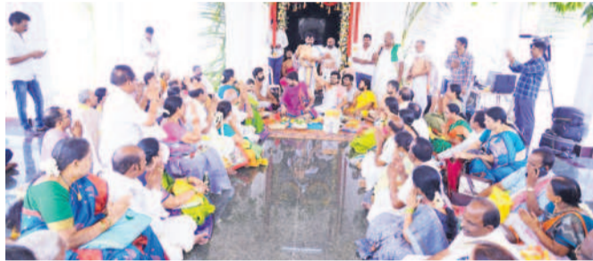
ప్రత్యేక పూజలో పాల్గొన్న భక్తులు