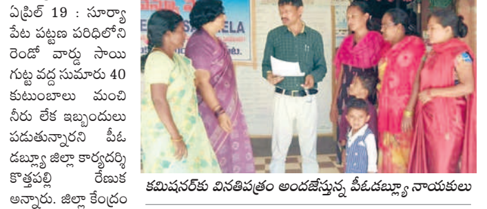
కమిషనర్ కు వినతిపత్రం అందజేస్తున్న పీడి బిల్లు నాయకులు

● సూర్యాపేట మున్సిపల్ కమిషనర్ కు పీడి బిల్లు నాయకుల వినతి