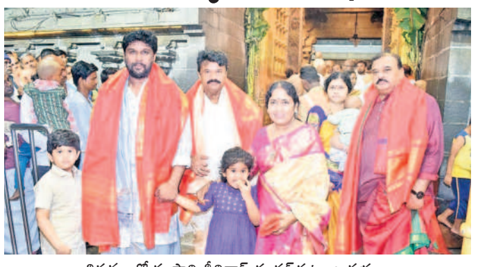
తిరుమలలో తలసాని శ్రీనివాస్ యాదవ్ కుటుంబ సభ్యులు

బేగంపేట, ఏప్రిల్ 20: మాజీ మంత్రి, సనత్ నగర్ ఎమ్మెల్యే తలసాని శ్రీనివాస్ యాదవ్ శనివారం తిరుమల వేంకటేశ్వరస్వామి మందిరం దర్శించుకున్నారు. తలసానితో పాటు కుటుంబ సభ్యులు సాయంతో దర్శించుకున్నారు. సుప్రభాత సేవలో పాల్గొని స్వామి దేవుని దర్శించుకున్నారు.