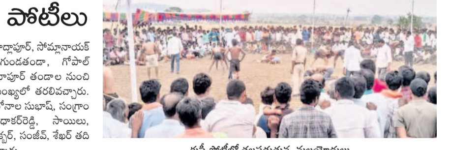
కుస్తీ పోటీల్లో తలపడుతున్న మల్లయోధులు