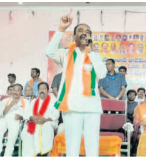
మాట్లాడుతున్న ఈటల రాజేందర్

ఎల్లారెడ్డి, ఏప్రిల్ 20: అబద్ధపు ప్రచారంతో గడ్డినెక్కిన కాంగ్రెస్కు పాలించే హక్కు లేదని, అసెంబ్లీ ఎన్నికల సమయంలో ఇచ్చిన హామీలను నెరవేర్చిన అనంతరం ప్రజలను ఓట్లు అడగాలని బీజేపీ నాయకుడు, మల్కాజ్గిరి లోక్ సభ అభ్యర్థి ఈటల రాజేందర్ అన్నారు. ఎల్లారెడ్డిలో శనివారం నిర్వహించిన బైక్ ర్యాలీ, సమావేశంలో ఆయన పాల్గొని మాట్లాడారు. అసెంబ్లీ ఎన్నికలకు ముందు ఇచ్చిన ఏ హామీని కూడా కాంగ్రెస్ అమలు చేయడం లేదన్నారు. దేశంలో కాంగ్రెస్ పార్టీ అధికారంలోకి వస్తేనే కేంద్రం నుంచి నిధులు వస్తాయని, అప్పుడు రాష్ట్రంలోని హామీలను అమలు చేస్తామని రేవంట్లరెడ్డి మరోసారి ప్రజలను మోసం చేస్తున్నారని విమర్శించారు. ఈసారి కాంగ్రెస్కు ఒక్క సీటు కూడా