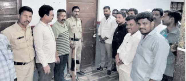
స్టాంక్ రూమ్ను సీల్ చేసిన అధికారులు