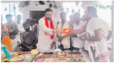
హోదా ఇచ్చిన ఎమ్మెల్యే మదన్మోహన్ రావు

ఎల్లారెడ్డి, ఏప్రిల్ 20: గామీణ ప్రాంతాల్లో కూలీలకు ఉపాధి కల్పించేందుకు కేంద్ర ప్రభుత్వం ప్రవేశపెట్టిన జాతీయ గ్రామీణ ఉపాధి హామీ పథకం లక్ష్యం సీరుగారుతున్నది. అధికారుల నిర్ణయంతో కూలీలకు గిట్టుబాటు కూలి డబ్బులు రావడం లేదు. ఫీల్డ్ అసిస్టెంట్ల (ఎఫ్ఎల్) నిర్ణయంతో తాము తీవ్రంగా నష్టపోతున్నామని కూలీలు ఆరోపిస్తున్నారు. పనులకు రాని వారికి కూడా ఫీల్డ్ అసిస్టెంట్లు హాజరు వేస్తున్నారని, దీంతో పనిచేసిన వారికి తక్కువ డబ్బులు వస్తున్నాయని ఆవేదన వ్యక్తం చేస్తున్నారు. పనుల్లోకి రానివారికి హాజరు వేసేందుకు ఫీల్డ్ అసిస్టెంట్ల వారి నుంచి కొన్ని డబ్బులు తీసుకుంటున్నట్లు ఆరోపణలు వినిపిస్తున్నాయి. తమకు పని కల్పించాలని కొన్ని గ్రామాల్లో కూలీలు డిమాండ్ పత్రాలను అందజేసి నా.. పని కల్పించడం లేదని ఆవేదన చెందుతున్నారు.