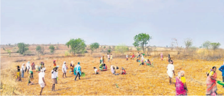
దేగంపూర్లో ఉపాధి పనులు చేస్తున్న కూలీలు

పెద్దకొడవగల్, ఏప్రిల్ 20: గ్రామీణ ప్రాంతాల్లో కూలీలకు ఉపాధి కల్పించేందుకు కేంద్ర ప్రభుత్వం ప్రవేశపెట్టిన జాతీయ గ్రామీణ ఉపాధి హామీ పథకం లక్ష్యం సీరుగారుతున్నది. అధికారుల నిర్ణయంతో కూలీలకు గిట్టుబాటు కూలి డబ్బులు రావడం లేదు. ఫీల్డ్ అసిస్టెంట్ల (ఎఫ్ఎల్) నిర్ణయంతో తాము తీవ్రంగా నష్టపోతున్నామని కూలీలు ఆరోపిస్తున్నారు. పనులకు రాని వారికి కూడా ఫీల్డ్ అసిస్టెంట్లు హాజరు వేస్తున్నారని, దీంతో పనిచేసిన వారికి తక్కువ డబ్బులు వస్తున్నాయని ఆవేదన వ్యక్తం చేస్తున్నారు. పనుల్లోకి రానివారికి హాజరు వేసేందుకు ఫీల్డ్ అసిస్టెంట్ల వారి నుంచి కొన్ని డబ్బులు తీసుకుంటున్నట్లు ఆరోపణలు వినిపిస్తున్నాయి. తమకు పని కల్పించాలని కొన్ని గ్రామాల్లో కూలీలు డిమాండ్ పత్రాలను అందజేసి నా.. పని కల్పించడం లేదని ఆవేదన చెందుతున్నారు.