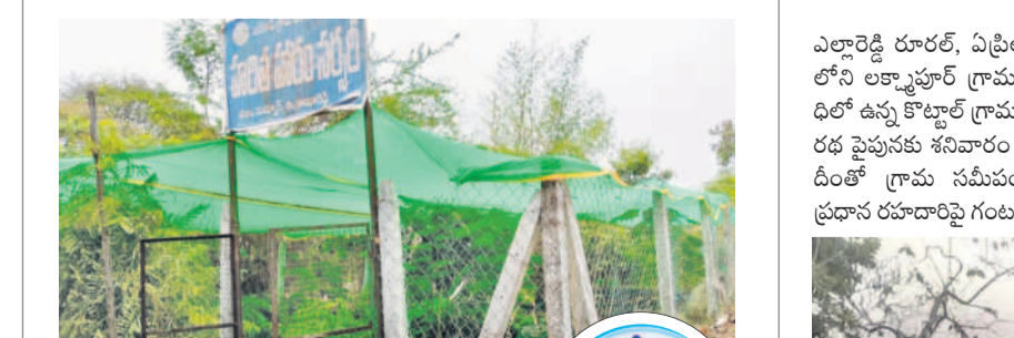
ఇల్లావోలో నర్సరీలో ఏర్పాటుచేసిన షేడ్ నెట్

డోంగ్గి, ఏప్రిల్ 20: మండలంలోని పలు గ్రామాల్లో ఏర్పాటుచేసిన నర్సరీల్లో మొక్కలపై గ్రీన్ మ్యాట్లు ఏర్పాటు చేయలేదు. ఎండలు తీవ్రమవుతున్న నేపథ్యంలో మొక్కలు ఎండిపోతున్నాయి. ఈ విషయాన్ని నమస్తే తెలంగాణ దినపత్రికలో 'నిర్వహణపై నిర్లక్ష్యం' అనే కథకం 19వ తేదీన ప్రచురితమైంది. దీనికి అధికారులు స్పందించారు. ఇల్లావోలో నర్సరీలో గ్రీన్ షేడ్ నెట్లను ఏర్పాటు చేయించారు. ఎండిపోయిన మొక్కల స్థానంలో కొత్తవాటిని నాటారు. దీంతో గ్రామస్థులు సంతోషం వ్యక్తం చేస్తున్నారు.