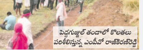
పెద్దగుజ్జల్ తడంలో కొలతల పరిశీలిస్తున్న ఎంపీవో రాజేంద్రారెడ్డి

తో మాట్లాడారు. పనులను కొలతల ప్రకారం చేపట్టాలని సూచించారు. కూలీలకు తాగునీటి అవకాశం ఉండాలని ఫీల్డ్ అసిస్టెంట్లకు సూచించారు. పనులకు పెద్ద సంఖ్యలో కూలీలు హాజరయ్యాలి చూడాలన్నారు.