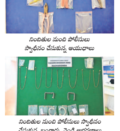
నిందితుల నుంచి పోలీసులు స్వాధీనం చేసుకున్న బంగారు, వెండి ఆభరణాలు