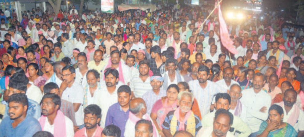
అత్యుక్త(ఎం) ర్యాల్లీలో పెద్ద ఎత్తున పాల్గొన్న బీఆర్ఎస్ నాయకులు, శ్రేణులు, జనం