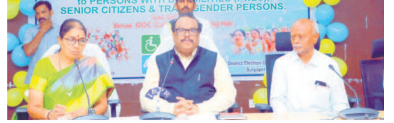
సమావేశంలో మాట్లాడుతున్న ఎన్నికల అధికారి, కలెక్టర్ వెంకట్రామ్