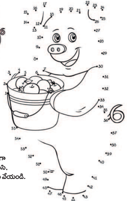
చుక్కల ఆధారంగా బొమ్మ గీసి, రంగులు వేయండి.