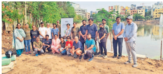
పానెల్ వర్సస్ ప్లాస్టిక్ అనే థీమ్ కార్యక్రమంలో పాల్గొన్న ప్రతినిధులు

మణికోండ, ఏప్రిల్ 21 : పర్యావరణ పరిరక్షణ ప్రతి ఒక్కరి బాధ్యతగా భావించి ప్లాస్టిక్ వాడకాన్ని పూర్తిగా నివారించాలని దృఢపాతం సంతకం చేసిన పాల్గొనేవారు.