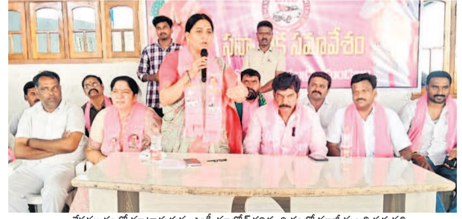
కేసీఆర్ మండల కేంద్రంలోని పార్టీ కార్యాలయంలోని పార్టీ కార్యకర్తల సమావేశంలో మాట్లాడుతున్న ఎంపీ మోదీ కవిత, బిత్తంలో మాజీ మంత్రి నత్తపతి

కాంగ్రెస్ పాలనలో ఆగమపుణ్యం రైతులు రుణమాఫీపై ఆగమపుణ్యం చేస్తారో సీఎం స్పష్టంగా చెప్పాలి వరికి రూ.500 బోసిన ఏపైంది? బలరాంనాయక్ ఈ ప్రాంతానికి చేసేదేమీ లేదు సన్నాహక సమావేశంలో ఎంపీ మోదీ కవిత మానుకోటకు గుర్తింపుని సీఎం : మాజీ మంత్రి సత్యవతిరాధాకృష్ణ