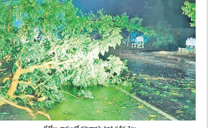
బేతోట గ్రామంలో రూపాద్రిపై విరిగి పడిన చెట్టు