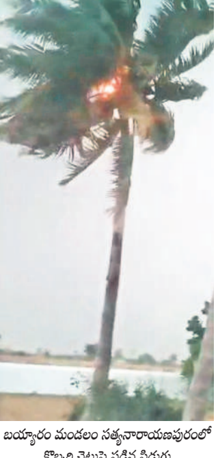
బయ్యారం మండలం సత్తనారాయణపురంలో కొబ్బరి చెట్టుపై పడిన పీడుగు

మానుకోట, జనగామ జిల్లాల్లో జోరువానీ విరిగిన చెట్లు, కూలిన కరెంట్ స్తంభాలు పలుచోట్ల పడుగులు, నిలిచిన విద్యుత్ సరఫరా