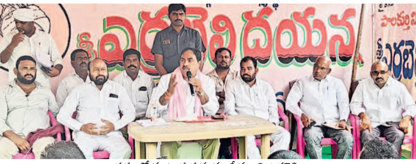
రాయవల్లిలో మాట్లాడుతున్న మాజీ మంత్రి ఎర్రబెల్లి