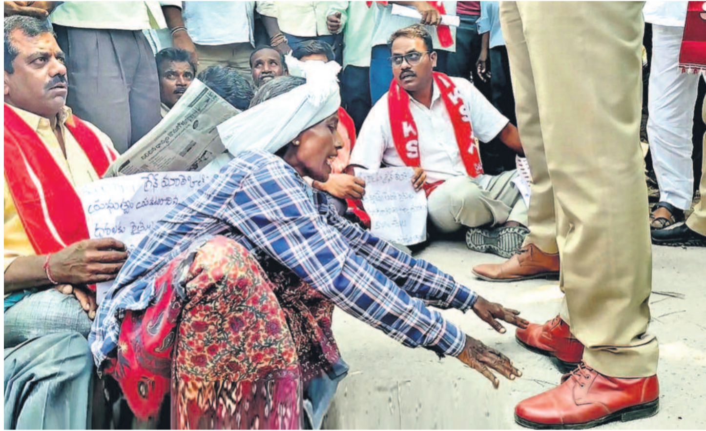
జనగామ మార్కెట్లో పది రోజులుగా ధాన్యం కొనుగోళ్ల నిలిచిపోవడంతో అక్కడి హుమాలిలు, దడువాయిలు, వాట, బీవురు కార్మికుల పరిస్థితి దయనీయంగా మారింది. ప్రభుత్వం రైతుల నుంచి వడ్లు కొనాలని కోరుతూ సోమవారం వారంతా ఆందోళనకు దిగారు. ఈ సందర్భంగా అనుచు అనే కూలీ.. రైతుల దగ్గర వడ్లు కొనండి సారూ.. బాంచెన్ కార్టోక్ట్ అని పోలీసుల కాళ్ల పట్టుకొని ప్రాణేయపడటం అందరినీ కలచివేసింది.

ట్రాక్టర్ లోడుకు 35 కిలోల బాదుడు కూలీల ఖర్చుకు ఒక్కో బస్సొచ్చురా..10 జనగామ జిల్లాలో >10 చెక్ కెస్ నూటికి రూ.2 చొప్పున కమిషన్ మిల్లర్ల మాయాజాలం >8వ పేజీలో