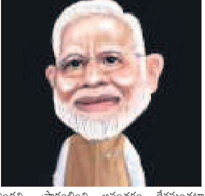
ప్రారంభించిన అనంతరం దేశమంతటా అమలు చేయాలనుకొన్నందున ఆరోపించారు.

'కాంగ్రెస్ వస్తే, షరియా చట్టం' కేంద్రంలో కాంగ్రెస్ అధికారంలోకి వస్తే, షరియా చట్టాన్ని తీసుకొస్తుందని ఉత్తర ప్రదేశ్ ముఖ్యమంత్రి యోగి ఆదిత్యనాథ్ సంచలన వ్యాఖ్యలు చేశారు.