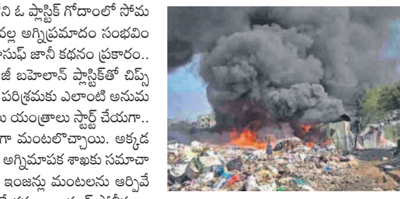
ప్లాస్టిక్ గోదాంలో మంటలు