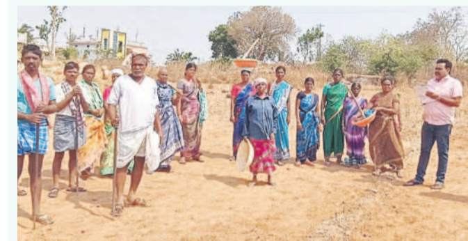
లగవెర్రలో కూలీలకు అవగాహన కల్పిస్తున్న ఉమ్మో

కూలీల సంఖ్య పెరిగింది: మల్లికార్జున్, ఉమ్మో మండలంలో ఉపాధిహామీ పనులు చేయడానికి కూలీలు పెద్ద సంఖ్యలో వస్తున్నారు. చెరువులు, కుంటల్లో ఒండ్రుముట్టి తరలింపు, పాలు క్యాల్షిండ్ ఫ్యాక్రీ తీసే పనులు, లేవలింగ్, కండకాల తవ్వకం పనులు జరుగుతున్నాయి. రోజూ 5,500 మంది కూలీలు ఉపాధి పనుల్లో పాల్గొంటున్నారు. ముందు ముందు కూలీల సంఖ్య పెరిగి అవకాశం ఉంది. పనులు నాణ్యతగా చేయడంతో పాలు రోజూ కూలీ రూ.300లు వచ్చే విధంగా పని చేయాలని కూలీలకు అవగాహన కల్పిస్తున్నాం.