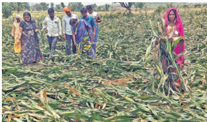
వడగండ్ల వానకు దెబ్బతిన్న పంటలను పరిశీలిస్తున్న ఏడీఏ అధికారులు

పరిగి, ఏప్రిల్ 22 : వడగండ్ల వానతో దెబ్బతిన్న పంటలను పరిశీలించడానికి ఏడీఏ అధికారులు పరిశీలించారు. పరిగి మండలంలోని ఇల్లూంపూర్, ఇల్లూంపూర్ తాండం పరిధిలో వడగండ్ల వానకు దెబ్బతిన్న పంటలను పరిశీలించిన ఏడీఏ అధికారులు పంటలను స్పాన్సర్ అంచనా వేసి ఉన్నతాధికారులకు పంపిస్తామన్నారు. వడగండ్ల వానతో 50శాతం పైగా దెబ్బతిన్న పంటలకు సంబంధించి 48 ఎకరాలు పరి, మొక్కజొన్న 12 ఎకరాలు, జొన్న 3 ఎకరాలు ఉన్నట్లు అధికారులు ప్రాథమికంగా నిర్ధారించారు. ఇదిలావుండగా 30శాతం నష్టపోయిన రైతులకు సైతం పరిహారం అందేలా చూడాలని రైతులు కోరుతున్నారు. మరోవైపు ఈడుగులాలలో రాలిపోయిన మామిడి కాాయలకు సంబంధించి సైతం పరిహారం అందించాలని పేర్కొంటున్నారు.