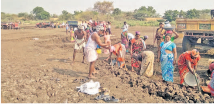
ఏర్పాటుచేసిన చెరువుల్లో ఒండ్రుముట్టిని తరలిస్తున్న కూలీలు

• 34 చెరువుల్లో ఒండ్రుముట్టి తరలింపు పనులు • ఉపాధి పొందుతున్న 5,500 మంది కూలీలు