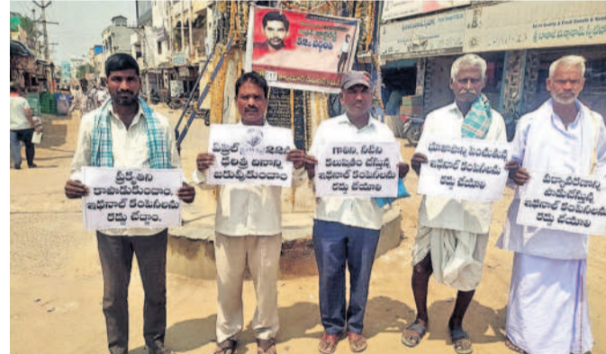
ప్రశ్నార్థకం ప్రదర్శిస్తున్న పోలూ కమిటీ సభ్యులు