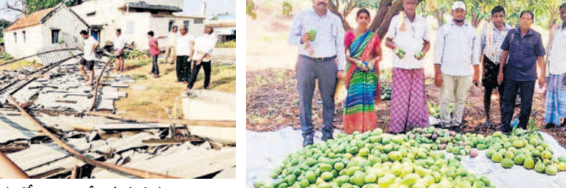
గార్ల : మామిడి తోటలో రాల్చిన మామిడికాయలు