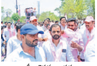
ర్యాలీగా వెళ్తున్న నాయకులు