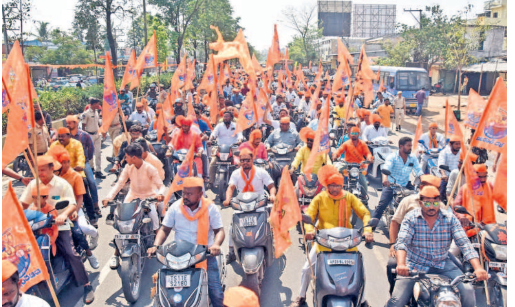
హనుమాన్ జయంతి సందర్భంగా కర్నూలులో హనుమాన్ ఆలయం ఎదురు నుండి వీహావేట్ ఆధ్వర్యంలో నిర్వహించిన భారీ ర్యాలీ

హనుమాన్ దేవాలయంలో, మలక్పేట బీ-ప్రస్థానం నుండి ప్రస్తుతాంజనేయస్వామి ప్రత్యేక పూజా కార్యాలయం, అక్కర్ బాగ్ లోని హరిహర క్షేత్రం