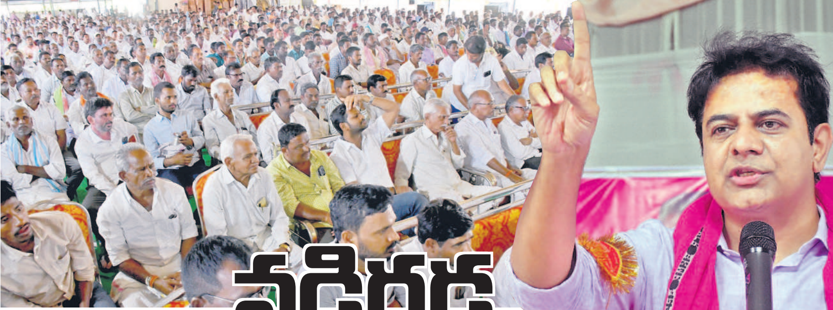
సమావేశానికి హాజరైన బీఆర్ఎస్ నేతలు, కార్యకర్తలు