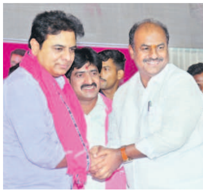
కేటీఆర్ కరచాలనం చేస్తున్న బండ్ల, చిత్తలతో విజయం

నీను నానా బూతులు మాట్లాడడం.. కేటీఆర్ మూడైతే పార్లమెంట్ ఎన్నికల్లో ఒక్క సీటు గెలవాలని సవాలు విధించారు. రైతుబంధు ఇప్పటికే ఉన్న సీటు గెలవాలని సవాలు విధించారు. రైతుబంధు ఇప్పటికే ఉన్న సీటు గెలవాలని సవాలు విధించారు. రైతుబంధు ఇప్పటికే ఉన్న సీటు గెలవాలని సవాలు విధించారు. రైతుబంధు ఇప్పటికే ఉన్న సీటు గెలవాలని సవాలు విధించారు.