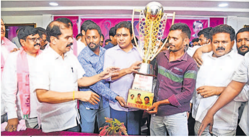
కేసీఆర్ క్రికెట్ కప్ విజేతలకు ట్రోఫీ ప్రదానం చేస్తున్న బీఆర్ఎస్ వర్కింగ్ ప్రెసిడెంట్ కేటీఆర్